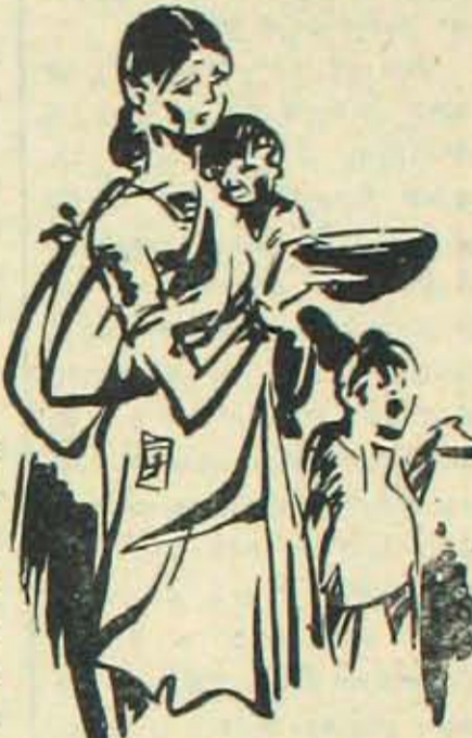
నాయనా నీళ్లు - అమ్మా బువ్వ - బాబూ బట్ట!

ఒక్కడి 1 కోటి 50 లక్షలమంది ప్రజలను దుర్భరమైన జైమువరిస్తోంది వెంటాడు తున్నది. గత మూడేళ్లలో సరిగ్గా వర్షం కురిసినసాపానసాలేదు. భూమి అంతా బాగాఎండిపోయిన వెరడు మాదిరిగాకయాలైంది. నదులు, చెరువులు, కాల్వలు, బావులు అన్నీ ఎండిపోయాయి. వంటపొలాలకు