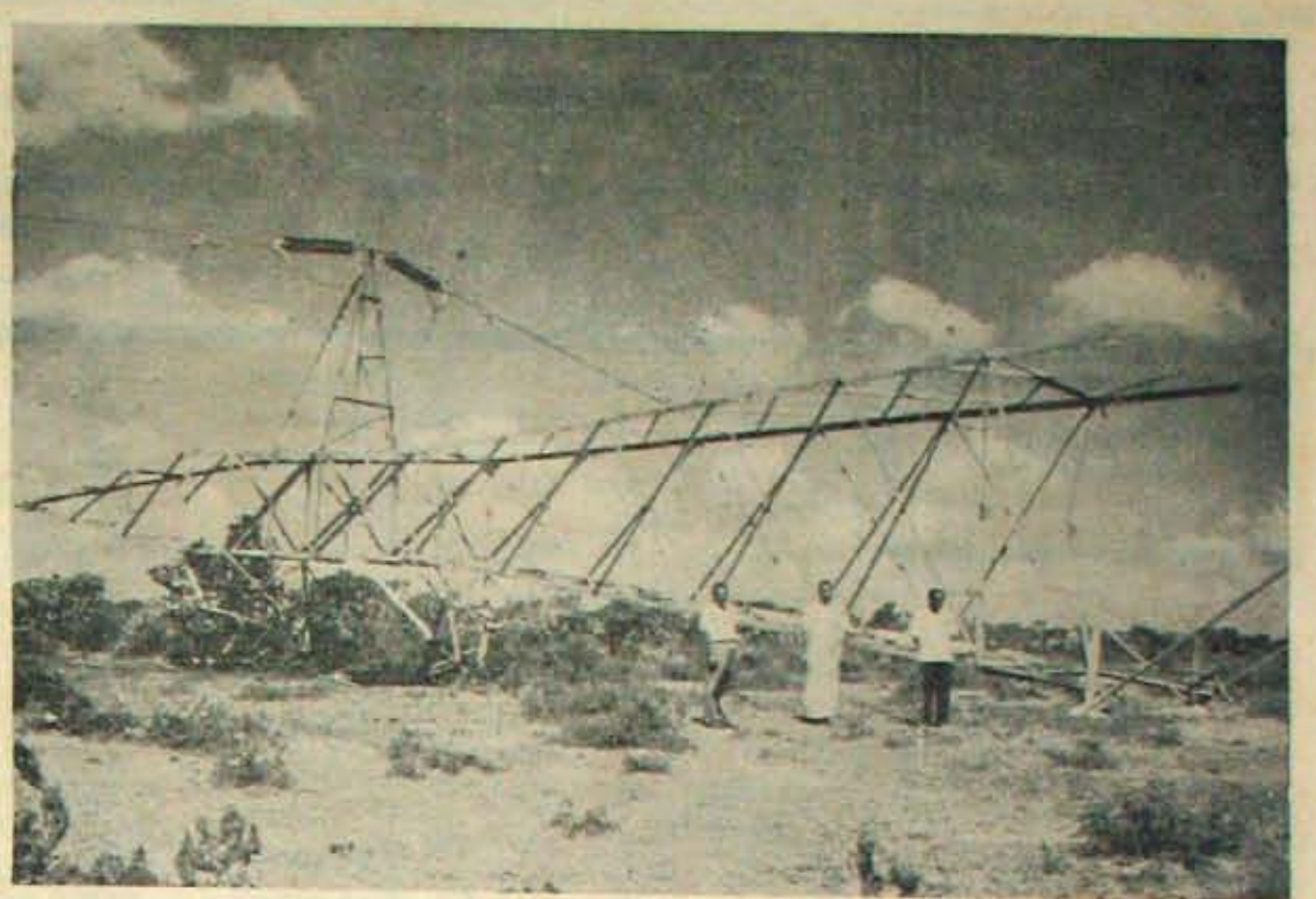
విద్యుచ్ఛక్తి కార్మికుల నమ్మకాలలో కోపూరుకాలాకా చంద్రశేఖరపురంవద్ద వడగొట్టబడిన 132 కె. వి. లైను ఉపయోగం. ఈ విద్యుత్ కర్తవ్యంవల్ల విజయవాడ ప్రాంతానికిపోయే 20 మె. వా. విద్యుత్ ప్రసారం 14 రోజుల పాటు ఆగిపోయింది.

ఈ సామగ్రి పాకీస్తీమకు చేంపని మనం అనుకోరాదు. మునుపటిమంత్రి —కొరవ 10వ పేజీలో