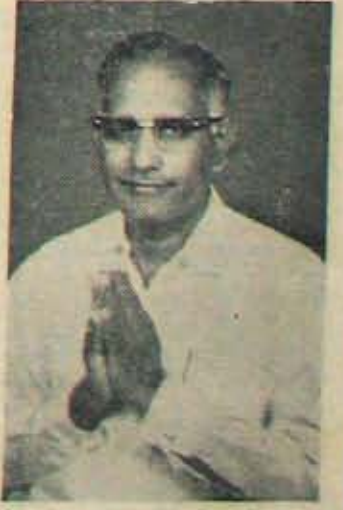
మి వా దు

అత్యుకారు నియోజకవర్గమునుండి అసెంబ్లీనిటుకు జరిగిన ఎన్నికలో నాకు ప్రేమాభిమానాలతో విజయం చేకూర్చి ప్రభాసేవ చేయు అవకాశం కల్పించిన ఓటరు మహాశయులకు, ఆవిరళకృపినిల్పి రమ సహాయ సహకారములనిచ్చి తోడ్పడిన కార్యకర్తలకు - తదితర పెద్దలకు నా హృదయ పూర్వక కృతజ్ఞతాభివందనములు తెలియ చేసుకుంటున్నాను.