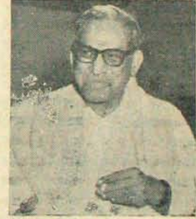
తానుకాక ఒకే ఒక అనుచరుణ్ణి సంపాదించుకో గలిగాడు. తన వర్గం ఎం