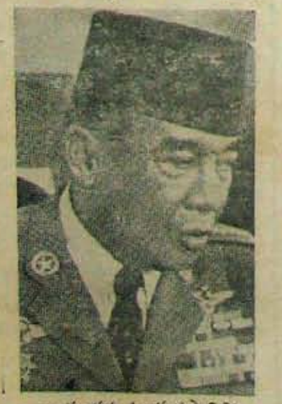
బలవంతపు 'వానస్రస్థానికీ' పోయిన సుకర్నో రష్యాకు అనుకూలమవుతారో లేక రుమే గియావల తమకివ్వవచ్చిన పక్క తి లో తమకు నచ్చిన కమ్యూనిస్టు పంథాను,

ప్రాచీనదిక నీతని అనుసరిస్తారో తెలియదు. ఏమైనప్పటికీ మావో వట్టునడలింది. మళ్ళీ చైనా అయినవరంగావడం దుర్లభ మని వరిశీలకులుంటున్నారు.