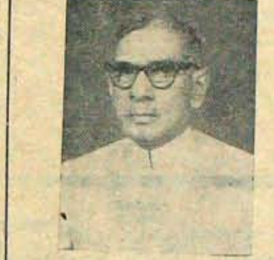
చెల్లెవోట్లు 15,566 శాసనసభ నియోజకవర్గాలవారి కావలి పార్లమెంటు పోలింగ్ వివరం.

కావలి నియోజకవర్గం వారు ఒక అర్హుడైన, కార్యదక్షుడైన అభ్యర్థిని నిరాదరించారు. నిదానంగా నైనా పోపాటును