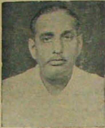
అన్నదాత మాధవరావు (నెల్లూరు-జనసభ)