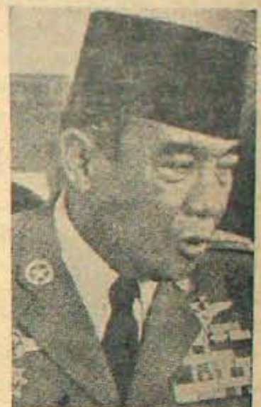
పాపం, సుకర్ణో! చచ్చిందా కా ఇండోనేషియాను పీలుదామని కలయకన్నాడు- కాని అసతికాలంలోనే వదలగలగలచైనాడు!

రష్యా సర్వసేనాధిపతి మనదేశానికే వచ్చినందుకు చైనా దుయ్యబట్టడం అనుకున్నాంగదా! అక్షేపింపింది. రష్యా-ఇండియాలు ఏకమై యుద్ధ దర్శకులు పూనుకుంటున్నవి. ఉద్యమాలిం తెవరిమీదనుకున్నాడు- చైనా మీదనే అని చైనా ప్రతికలు వ్యాఖ్యానించినది. పాశ్చాత్య సామ్రాజ్యవాదులు ఎన్నడూ రష్యాపై సాధించినంత చైరాన్ని చైనా పూర్వపునదని సోవియట్ యూనియన్ కమ్యూనిస్టు పార్టీ కార్యదర్శి జహిరంగంగా ఆరోపించాడు.