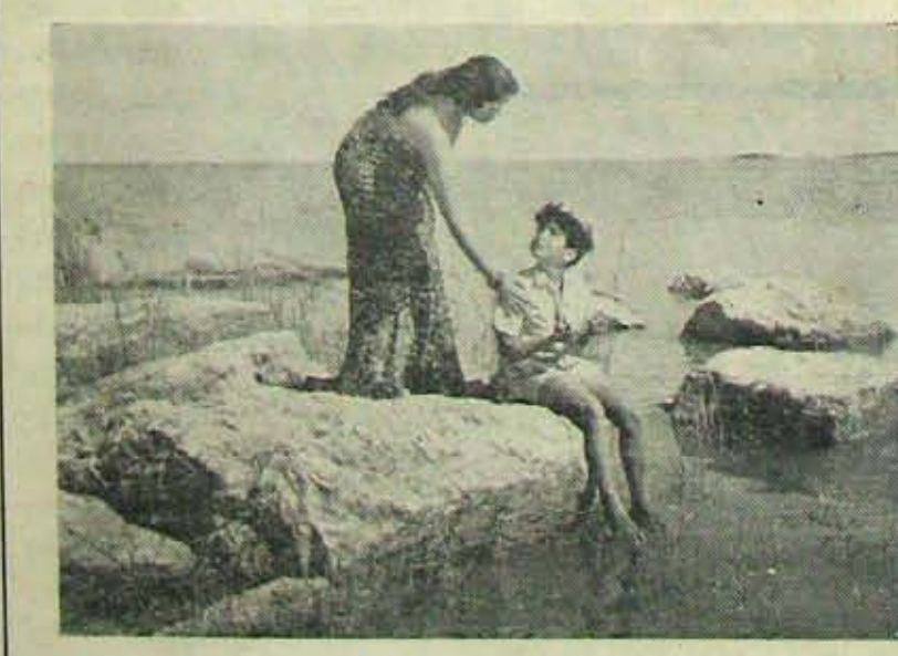
'మా వదిన్'లో కృష్ణకుమారి. జన్మవాద పెన్నానది తీసిన బోల్డ్స్ దృశ్యం.

నిజమేదామరీ! భారత దేశంలో వ్యముఖ నటీనటులయిన సరోజాదేవి పెళ్లి. ఎంతో వైభవంగా ఏర్పాటు జరిగింది. అలాంటి నందర్యాలలో ఏలవా, పెట్టరి పేరంటానికి వచ్చే వేలాది జనాన్ని పోలి నులు సైతం అడుపులో పెట్టలేక పోవడం