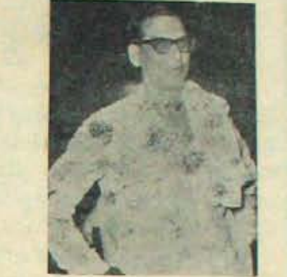
కావలి విజయానికి అన్నీ అపశకునాలే!