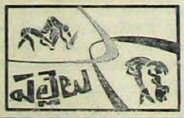
(5 వ పేజీ కొరవ)

ఎద్దుల మీద ముద్రకొట్టారని కోడూరు తానకిరామరెడ్డిగారి తలమనిషి రోడ్లో తిరుగుతుండిన ఆ దాకలివార్ల గాడిదలను తన యజమానిదొడ్లో తోలాడు. (7) పాలి చర్ల రాజుపాలెం గ్రామస్తులకు చెందిన 500 మేకలను, 100 అవులను గూడూరు రైతులనిర్వహించి, కర్మావధిపెట్టారు. (8) పాలిచర్లవారిపాలెంలో పాలు అమ్ము తనే ఒక అనామకణ్ణి నానాదారలపెడుతు న్నారు. (9) చల్లంపల్లిలో కాంగ్రెస్ కు ఓటిచ్చిన హరిజనులకు మందిసిట్లకూడా లభ్యంకాకుండా చేయాలని గుంటకు ఇం జాపెట్టి సిట్ల తోడేస్తున్నారు. కర్లకరు వుత్తరువునుకూడా వీరు ధిశకరిస్తున్నారు. ఈ విషయం నడకర్లకరుగారి దృష్టి కి తీసుకపోవడం జరిగింది. (10) తూపిరి, బాడిదవారు, అందలమాల, కొండాలు హరిజనులు కడువదిపాతున్నారు.