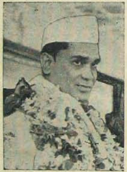
రాష్ట్రపతిత్వానికి విముఖతచూపిన జయప్రకాశ్ జీ

చైనాను డీ కొన గల శక్తిని అన్ని విధాలా సంపాదించామంటే, చక్కలో