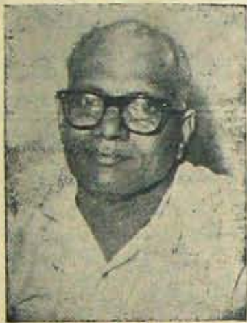
లెఫ్టెంట్ కమ్యూనిస్టుపార్టీ ప్రధాన కార్యదర్శి, చైనాభక్తుడు శ్రీ సుందరయ్య

గిట్టనివారిని చుట్టుముట్టి జబర్దస్తీగా వసులు సాధించుకునే సైరాబోవుదళమం ప్రారంభమైంది వశ్యమయెంగాలులో. తెరుగుబాటు, పోటీపరిపాలనలు జరగుతున్నది వశ్యమయెంగాలోని నెక్టల్ బరీలో. లెఫ్టెంట్ కమ్యూనిస్టులు రాష్ట్ర పాలనలో ప్రాధాన్యం వహిస్తున్నది (కేరళ మినహా) వశ్యమయెంగాలో. చైనాకు నరిహస్తుగా, చైనాతోకగా వుంటున్న పాకిస్తాన్ కు ప్రకృతాష్ట్రంగా వుంటున్నది వశ్యమయెంగాలో. చివరికి తున్న వార్తలు, వదంతులనుబట్టి దేశ ద్రవతకు, దేశస్యాకంక్యానికి ప్రమాదకరంగా పరిణమించవోయేరాష్ట్రంగాదా ఈ వశ్యమయెంగాలోగానే వుంటుందా అనిపిస్తుంది.