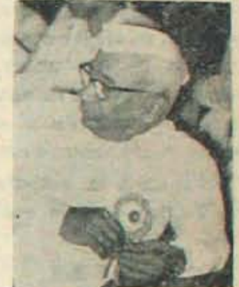
స్థానం ఆవ్రతివతంగావుంది. ఆమె ఎవరిని ఎందుకు ఎన్నుకు తెరచిస్తారో, దూరంచేస్తారో ఎవరికి అంతువల్లకుండా పోతున్నదనీ, అధికారమంతా ఆమెలోనే కేంద్రీకృతమైపోయిందనీ తిట్లెసుందివచ్చిన -కారవ 2 వ పేజీలో