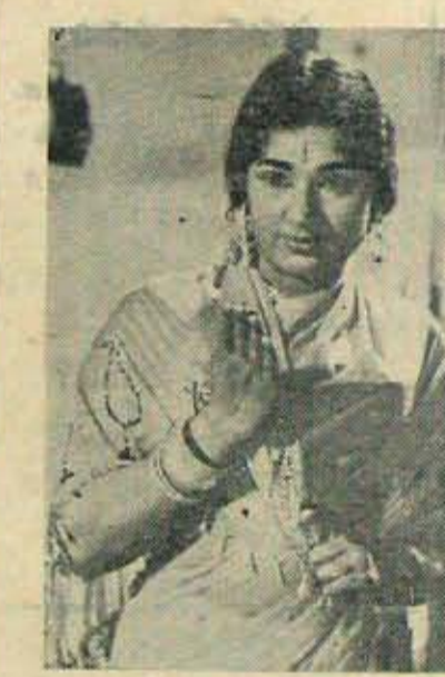
శ్రీ ప్రొడక్షన్స్ "మరపురానికథ"లో వాణిశ్రీ, సంద్యారాణి

ఈ ఉత్సవాలవల్ల లాభాలుగుర్తించి కూడా ప్రభుత్వం తగిన శ్రద్ధ చూపడం