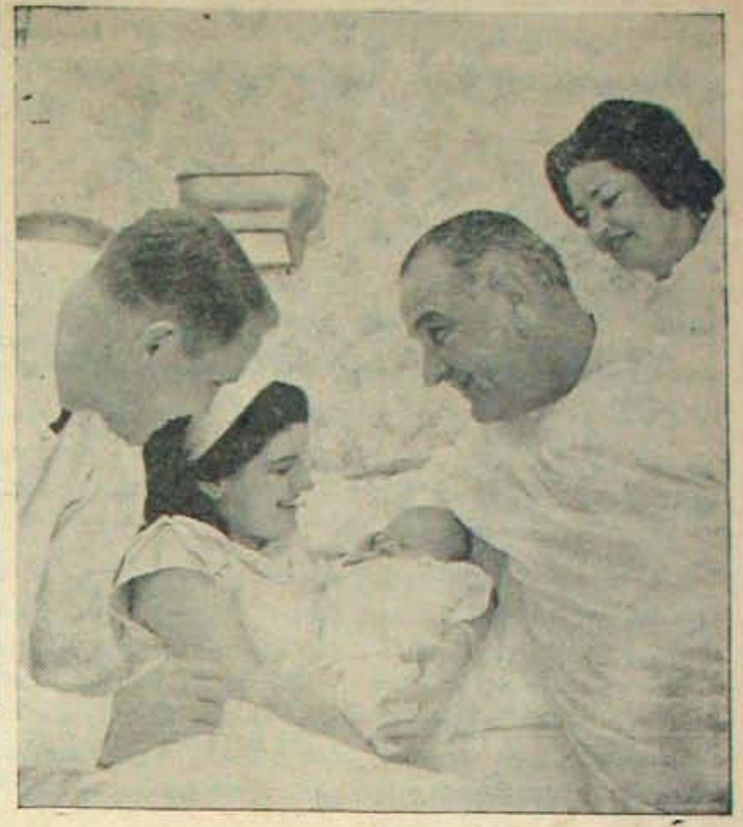
ఎంత పెద్దవాడైనా, ఎంత పెద్దవదదిలో వున్నా పంసారపు బాధ్యతలు, మర్యాదలు తప్పవు. పెద్దవారికి సంబంధించిన దిన్నవిషయంకాదా ప్రవచనపువార్త అవుతుంటుంది. అమెరికా (పెనిడెంటు శ్రీ బొన్సాకామారై శ్రీమతి లూసి, అస్టికా (పెన్యాన్ రాష్ట్రం) లోని సీటా అన్యతిలో మొదటివిద్వంశ కన్నడకు. బొన్సాకా నతినమేకంగా ఆ అన్యతికిపోయి విద్వంశు చూదాడట. దీక్షలో ఎడమవైపు బొన్సాకా తూకు, అల్లుడు, మనుమడు; కుడివైపు బొన్సాకా దంపతులు వున్నారు.

ఇటాలి అది మునుపే గ్రహించింది; అమెరికన్ తోకాన్ని అపేక్షించక, అమెరికా సాయాన్ని న్యయంశక్తితో వినియోగించుకుని, యుద్ధవైఖ్యాన్ని ప్రదర్శించి తనకంటే అన్నివిధాల ఎక్కువ బలగం గల శత్రువునాచొన్ని శుక్రుని యలు చేసింది.