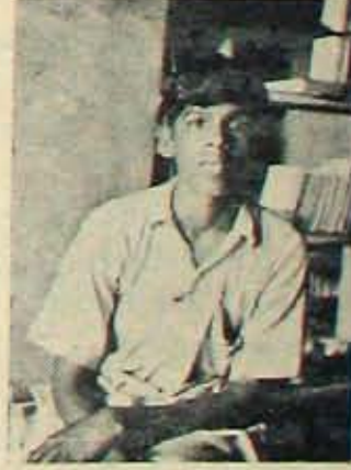
ఉన్నత వైద్యశిక్షణపై ఆమెరికా వెళ్లిన నెల్లూరు యువకుడు

వీటి అరికట్టే తరుణోపాయ మేరైనా వుందా? ఇంతదాకా వీటి అరికట్టేదాని -కొరవ 8 వ పేజీలో