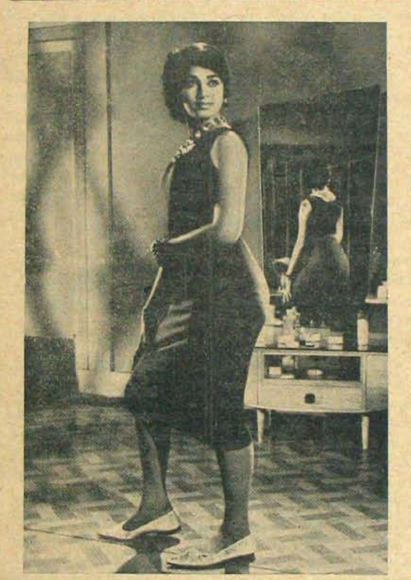
'హంతకుని హత్య' లో ఒక అందం, ఆకర్షణ!