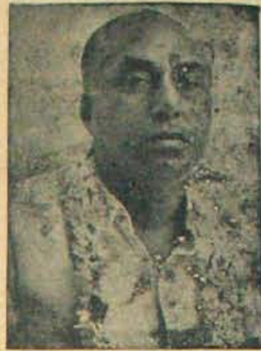
లోని 15 వందల ఓట్లలో నాయుడుగారు సగం సులభంగా పోలు చేసుకోగలరు. ఒక్క ఉలవపాదా పిల్లలో మాత్రం ఇరువదికి సమానంగా రావడమే; లేక కోటారెడ్డిగారికి ఒక వెయ్యి ఓట్లు ఎక్కువ

ఇక నాయుడుగారికి సూచనలు ఉట్టిచే గ్రామాలు చాలావున్నాయి. వారి పంపాయితి ఒక్కటే రెండువేల ఓట్లు నిస్తుంది. నిష్పాక్షిక పరిశీలకుల ప్రస్తుత అంచనా ప్రకారం - నాయుడుగారికి సంగరాయకొండపిల్లలో 4,5 వేల ఓట్ల రీతి లభిస్తుంది. కందుకూరు పిల్లలో వదిలొట్టు ఎక్కువ రావలసిందే గాని, ఏ పరిస్థితుల్లోను తగ్గవు. గుడ్డూరు పిల్లలో