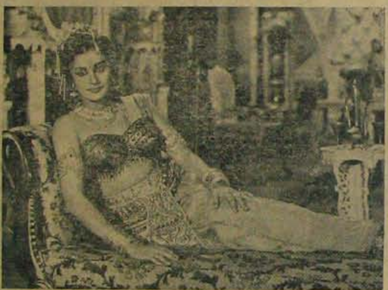
'వీరపూజ' లో కాంచన