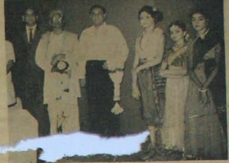
కుమారి గిక్, కుమారి శేఖరి వలె నెల్లూరులో శ్రీ మంకేశ్వర కళాగలయం సహాయక వాదనాది స్యత్యవర్ణనమిచ్చారు. గిక్ చేసే మనోబలం తో అలవయం; గిక్, శేఖ, సునికలు ప్రవర్చించిన వుంది, ప్రశంసలందుతున్నవి. దిక్ కంలో న... వాటి ప్రవర్చనానికి అభ్యర్థం చేపించిన కలెక్టర్... వుపస్థాపించిన శ్రీ మంకేశ్వర కళాగలయం; గిక్, శేఖరి కంటి... సేవకులడిగినట్లే, యజ్. జి. ఓ. లు... అడుగుతున్నారు. ఇతే యస్. జి. మన నమ్మకం వారి వెట్టుకుంటే వారి ఎట్టువైపు... మనకు మొగం చేశద్యస్తే వుంటుంది. ఒక అ... అవుతుంది. కాని, వారి కిప్పుడు... నీ మెచ్చ కాదు. వారి కి... జిచ్చితే, రైల్వే లెటర్ సంపాదించుున్న సంకుశక్తి. దానిని వారు సంపాదించుతున్నారు. శక్తి డిశరకవుండదు. దానికి ప్రయోగం కావలెను. అది జరుగుతున్నది. లేకుంటే ఎన్నుకైనా యజ్. జి. ఓ. ల వంటివారుకొం లైళ్ళకు వెళ్ళడం కన్నామా, విన్నామా?

కంపెనీలలో తేదాలున్నట్లే, ప్రభుత్వాలలో తేదాలు కన్పిస్తున్నవి. కంపెనీల