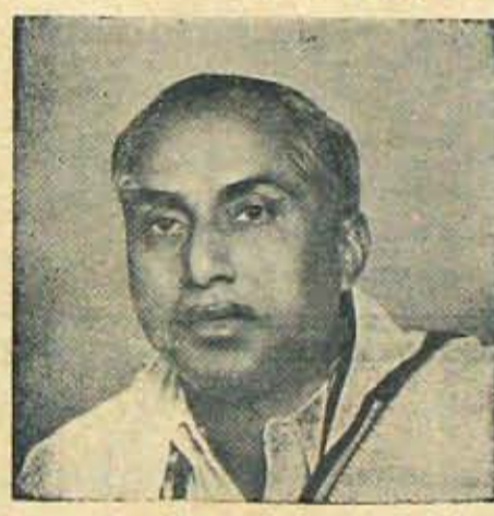
వాడికి 1 రాగలవని చెప్పవచ్చు. కమ్యూనిస్టు రావడమంటూ జరిగితే కొండపిలోనే.