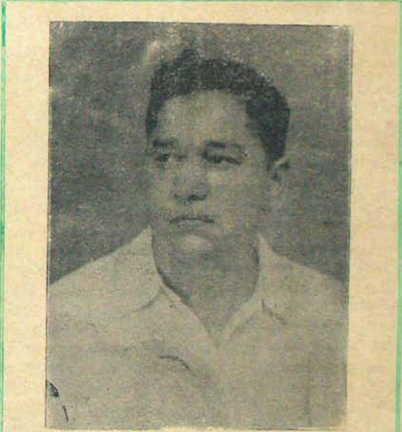
అల్లూరు నియోజకవర్గ ఓటర్లకు

కావలి, కందుకూరు ఎన్నికలవరనే అన్ని నియోజకవర్గాలలో వుంటే, ఇక