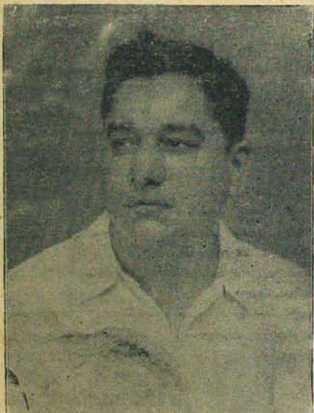
అల్లూరు నియోజకవర్గ ఓటర్లకు