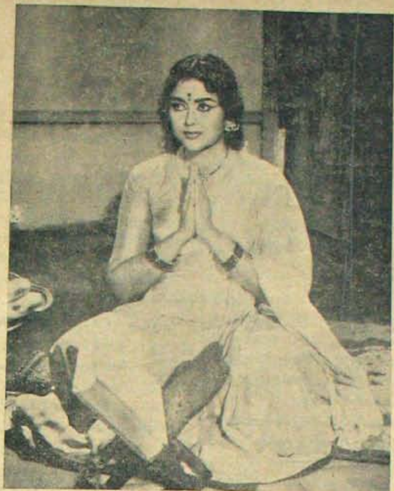
దర్శనంపెట్టడం యీ ఓటింగ్ రోజుల్లో మామూలు. మరి 'మా వదిన్'లో కృష్ణకుమారి ప్రేక్షకుల ఓట్లకోసం దర్శనం పెడుతున్నదా?

ఇది నినిమా నిర్మాతలకేమోగాని నట సామ్రాజ్య గారి ని అపమానించినట్లే