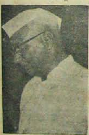
ఎవ్వరినీ సంతుష్టిపరచలేకపోయిన ముఖ్యమంత్రి

నెయింకాకీలగు నెల్లూరు - చిత్తూరు జిల్లాలకు యం. జి. బ్రదర్సు, పొగతోట ఫోన్ : 306. నెల్లూరు.