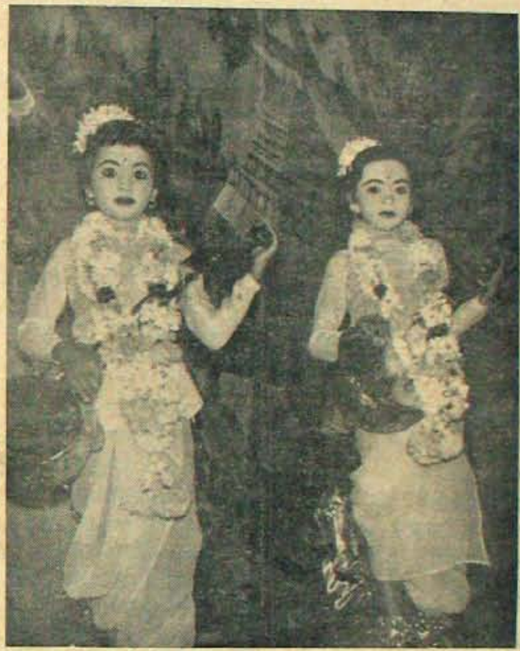
పాతకాల వక్షమున ప్రదర్శించబడిన "లవకుశ" నాటకంలో లవకుశులు దిరగిస్తున్న హేమలత, ప్రమిల.

ప్రభుత్వాల కేంద్రంలో - రాష్ట్రాలలో రాగలవు.