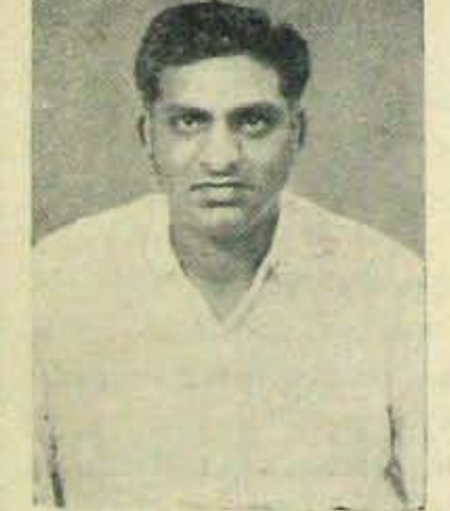
వీరిరువురి సీట్లు సర్దుబాటు కావాలి!