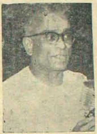
మంతటినుండి అయితే ఇంకెన్ని వందల

రాష్ట్రంలోని కాంగ్రెస్ వాదులంతా ప్రస్తుతం ఢిల్లీ ప్రయాణ సన్నాహంలో వున్నారు. ఆంధ్ర అభ్యర్థుల పరిశీలన దీనినిబరు 2 తేది ప్రారంభమవుతుందని, రెండు మూడు రోజులలో పూర్తికావచ్చునని తెలుస్తున్నది. ప్రదేశ్‌కాంగ్రెస్ అభ్యర్థుడు వగైరా అధికార పక్షియులు 26 తేది బయలుదేరుతున్నారు. ఒక్క హైదరాబాదునుండే ఢిల్లీకి నిన్నటి వరకు 146 మంది రైల్వో సీటు రిజర్వుచేసుకొని వున్నారట. రాష్ట్ర