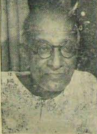
100 పార్లమెంటు సీట్లు- 1000 శాసనసభస్థానాలు-

స్వతంత్రపార్టీ తన ఎన్నికల మూని పెట్టాను విడుదల చేసింది. వీం అడుగు తున్నదో చూడండి: "వచ్చే ఏ బ్రవరి జనరల్ ఎన్నికల్లో లోకనరకు కనీసం వందమంది స్వతంత్రపార్టీ పార్లమెంటు సభ్యుల్ని వంచండి, కాంగ్రెస్ రాజ్యం వక సమై తీరుతుందని హామీయిస్తాం." దేశం మొత్తంమీద వివిధ విధాననర లకు వోక వెయ్యి మంది స్వతంత్రపార్టీ వార్షి, (కొన్ని రాష్ట్రాల్లో మెజార్టీతో) వంచండి, రాష్ట్ర స్థాయిలో పరిపాలన ప్రజాకనను స్వతంత్రపార్టీ ఎట్లా చేస్తుంది, సత్పరిపాలనంటే ఎట్లుండాలో చూపిస్తాం- అని అంటున్నది. నరే యిక ఆనక ఆర్థిక-సామాజిక విషయాలపై తన దృక్పథమేమిటోకూడా సవివరంగా చెప్పకున్నది. ఎన్నున్నా వోకటిమాత్రం నిజం-సోషలిజం మత్తు మందు మోతాదులేకుండా కాంగ్రెస్ కు వోక స్వప్నప్రత్యామ్నాయాన్ని సూచిస్తున్న పార్టీల్లో స్వతంత్రపార్టీకి అగ్రస్థానం. ఇందుకు కొంత 'జనసంఘ' కూడా తుడి యెడమగా వస్తుందనేమాట పూర్తి గా కాదనలేకాని మిగతా పార్టీలన్నీ ఎంతో కొంత సోషలిజం మోతాదు వుండాలని కోరేవే. ముఖ్యంగా ఆర్థిక విషయాలపై దేశస్థాయి చర్యల్లో స్వతంత్రపార్టీవారి వాణిశీకమైననుగిరింపు యేర్పడకపోలేదు.