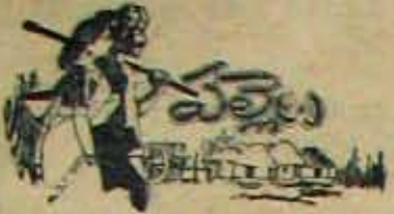
(5 వ పేజీ కొరవ)

ప్రభుత్వం ఎక్కువ మందినంది అని చెప్పే వాదనలక పోతుంది.