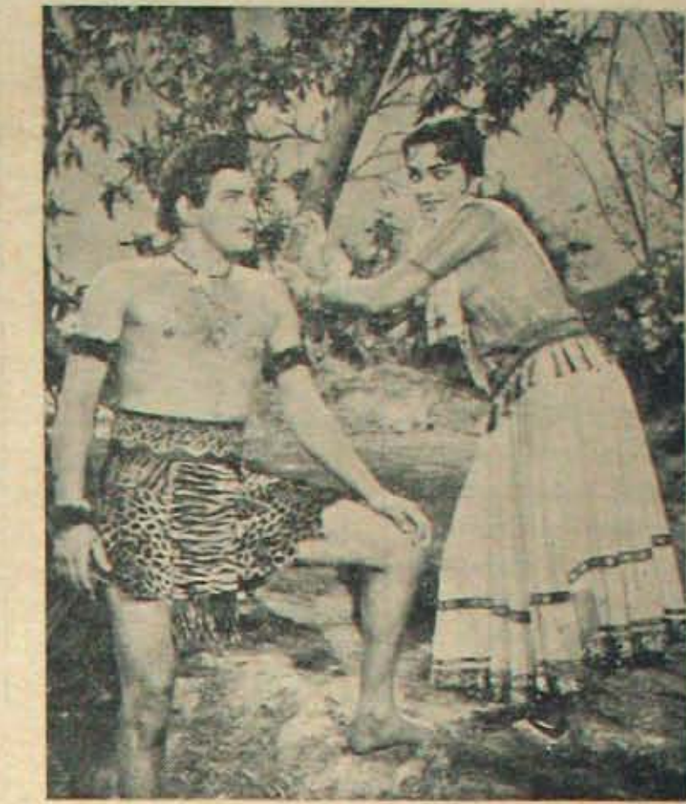
'ప్రేమలో ప్రమాదం' లో కృష్ణ, సంధ్యరాణి

తెలుగులో 'బాపు' పేరుచెలితే, వత్రి క లు చూడేవారికి తెలుస్తుంది. గొప్పదిత్ర