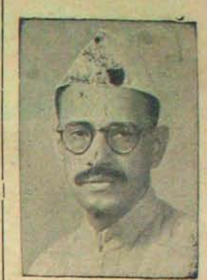
మాశ్వర్యాలను, అవేదనా విధారాలను నందా రాజీనామా కల్గించడంలేదు. దైవా దండయాత్ర అనుకరం కృష్ణ - కొరవ 12 వ పేజీలో

7 తేదీ డిల్లీ అరాజకమే శ్రీ నందా రాజీనామాకు కారణం. శాంతిభద్రతల రక్షణలో ప్రభుత్వం, అంటే ప్రజాశాఖ, పూర్తిగా విఫలమైంది. డిల్లీ లెవ్వనెంటు గవర్నరు ఆరోపించినట్లు ప్రజాశాఖ అధ్యక్షుల్లోవుండే 'ఇంటిలిజెన్స్' విభాగం అ నాటి సంఘటనలను ముందుగా పసికట్ట లేకపోయింది; ఆ పరిస్థితిని ఎదుక్కొను టుకు తగినవర్యలు తీసుకోలేకపోయింది. దానివల్ల డిల్లీలో ప్రభుత్వమనేది పున్నదా పూడిందా అనే దౌర్భాగ్యస్థితి కలిగింది. అందువల్లనే సందాగారు రాజీనామా యిచ్చారు. డిల్లీ కల్లోలం కల్గిందిన సంత్య