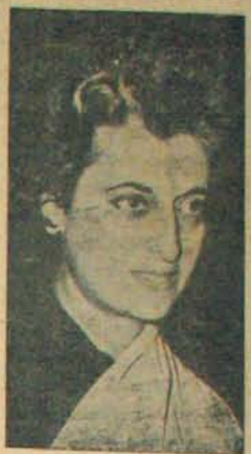
అందరికీ తిరచి ఆకాశం గం కల్పించారు.

డిమాండు వదిపోయింది. విదేశీ సహాయం అనుభవమేరకు రాకపోవడం, పాకిస్తాన్ లో యుద్ధం, రక్షణకోసం పెరిగిన ఖర్చు, వగైరాలయ్యాయిగా యున్న ప్రధానమైన అడ్డంకులు కార్యక్రమాలు కుంబు