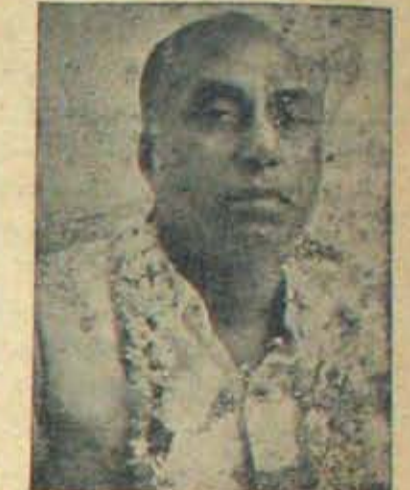
రెండుజాబితాల్లో కోరిన స్థానాలు