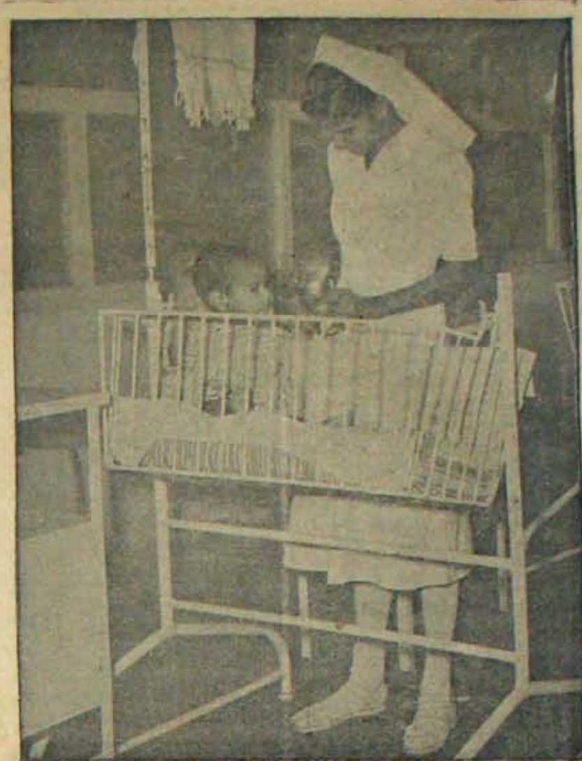
మనదేశంలో యీనాడు 14,600 అన్నపత్రులున్నాయి. 1950 లో 8,600 మాత్రం వుండేది. అన్ని రంగాలలోకాటు వైద్యరంగమూ ఎంతగానో అభివృద్ధి చెందుతున్నది. సంఖ్యాత్మకంగా కనపడే యీ అభివృద్ధి గుణాత్మకంగా; అంటే మన అన్నపత్రులు సేవ దయ భావ వికసితం కాగలిగినప్పుడే పార్థకం. ఒక అన్నపత్రుని దిన్న బిడ్డ అయిన రోగికి సర్దు యింత ఆహ్వాయతతో పాలు త్రాగిస్తున్నదో కూడండి. అలాంటి దయాద్రవ్యహృదయమే అన్నపత్రులో వని చేసేవారికి కావలసింది!