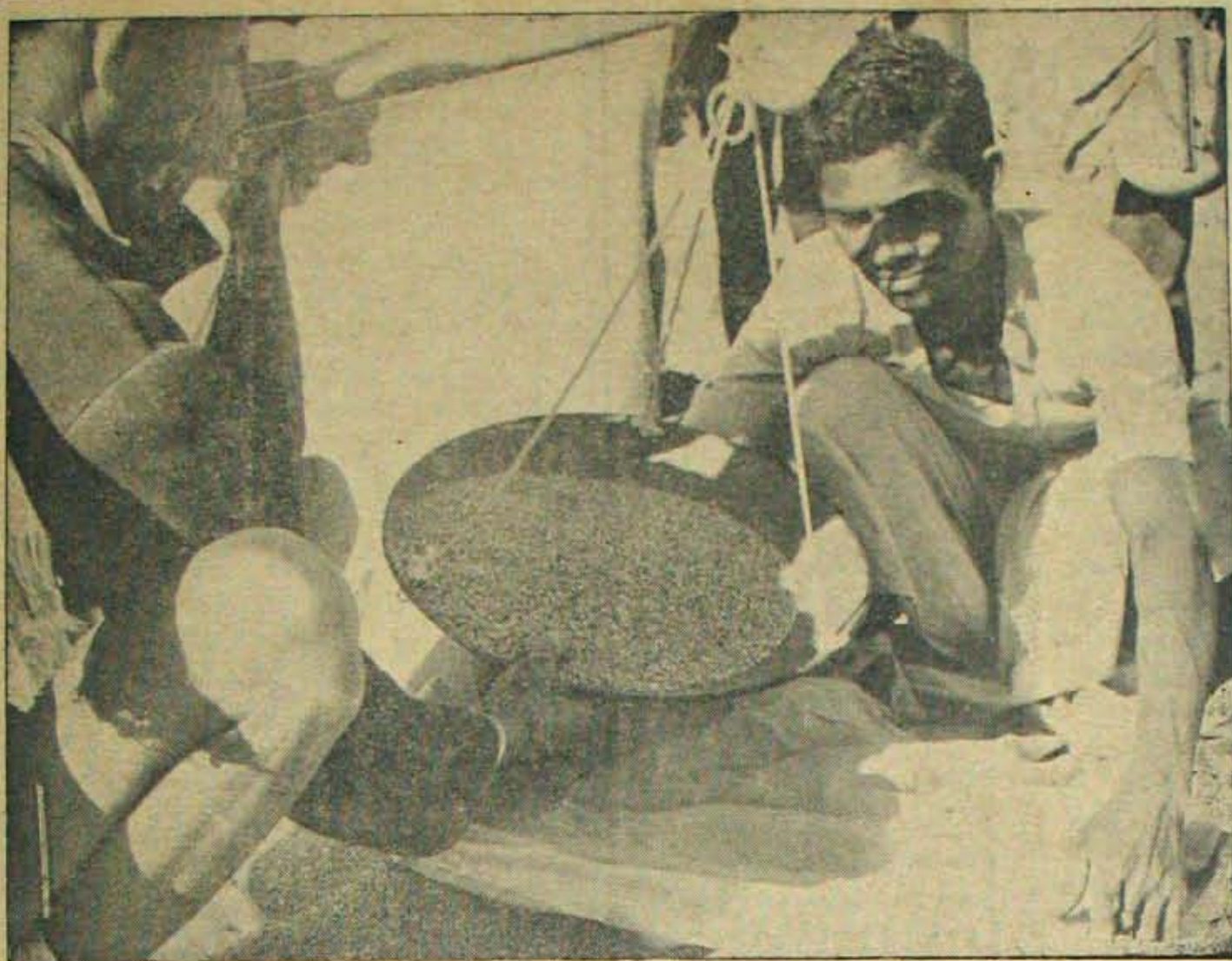
ఉత్తర ప్రదేశ్ లోని యూన్సిటీల్లో వురాతనమైన చెరువులు, కాల్యాల వనరులైన బియ్యంపంటిని ప్రపంచ ఆహార కార్యక్రమం కింద మరుగ్గా జరుగుతున్నది. ఈ కార్యక్రమాలకోసంగా ఆమెరికా ప్రభుత్వం 1800 టన్నుల గోధుమలను వృద్ధిగా యిచ్చింది. రోజూకూడా రెండుకిలోల గోధుమలు ఆ కార్యక్రమంలో వనిజేసిన రైతుకు తూది యిస్తున్నారు. ఈ విధంగా ఒక్కచోట రోజూకు 100 మంది వంతున 85 రోజులు గోధుమలూ యిచ్చారు. దబ్బుకూలికంటే ధాన్యంకూలి ఎంతో లాభదాయకంగా!