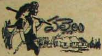
(5 వ పేజీ కొరవ)

మర్నాటి మారిపోయారు అందా! ఈ మారిపోయినవారిలో ఒకరు రాజకీయ ప్రకటన గలవ్యక్తి, ఉదయగిరిలో అందోళనలు నడిపేవ్యక్తి; అతివాద కమ్యూనిస్టుగా రావించడం వ్యక్తి అట. అయితే మారగూడదని వుదా పిడి!