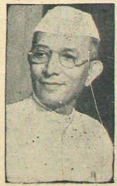
రాష్ట్రంలో మూడవ వర్గానికి విజయవంతమైన మొరార్జీ

ఢిల్లీనుండి వస్తున్న వార్తల ప్రకారం, కాంగ్రెస్ అభ్యర్థులకి, ప్రధాని మంత్రిత్వం అప్పిచాయ లేదా అలా ప్రగాఢంగా ఏర్పడ్డాయి. ఏదో తంటాలు వదిలమ అభ్యర్థుల వర్తకలకు అమోదముద్ర వేయించుకొని తెచ్చుకుందామని ఢిల్లీ వెళ్లిన అంధ్యకాంగ్రెస్ నాయకులకు దిగ్భ్రాంతి కలిగించేటట్లు ఈ వరిణామం కనిపించింది. ఇలాంటి పరిస్థితికి కనిపెట్టుకొని ఘోషిస్తున్న మొరార్జీదేశాయ్ గారు ఒకొక్కసారి ఒకొక్క నిర్ధారణపేర ఒకొక్కరిని నమస్కరిస్తూ తమ వ్యక్తిగత వలతులను, ప్రణామాన్ని పెంచుకుంటున్నారు. ముందాగా ప్రస్తుతం, తమ ప్రతిష్టనుకూడా ఇసుమడించే సే