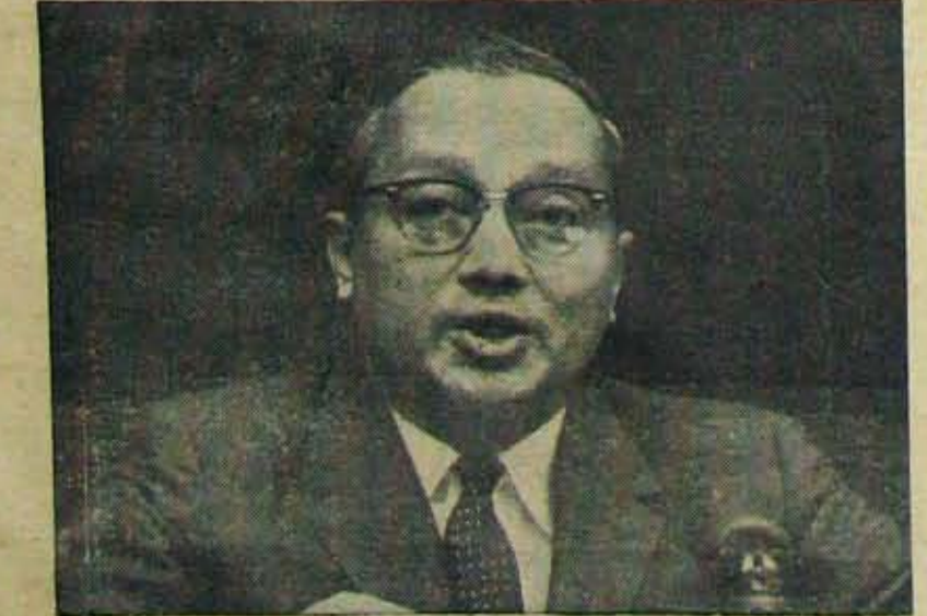
అట్టిలేటరు బకరాజ్యసమితివార్యదర్శిగా కొనసాగుటకు నమ్మకం, ఎన్నుకోబడిన శ్రీ ఉధాంట్

—పి. ప్యభాకరశాస్త్రి - వాది-(డి. హా.) అద్యక్షతేయ.