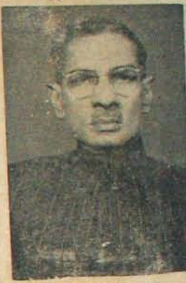
“అల్లూరు వచ్చి నంబోవం - రాకుండు దింకలేదు”

పాటిల్-మొరార్జీ-చవాచా త్రిసభ్య సంఘం నెల్లూరు జిల్లాకు సంబంధించి నాలుగు స్థానాలకు అభ్యర్థులను సిఫారసు చేయకుండా, శేంద్ర ఎన్నికల సంఘ నిర్ణయానికి వదిలివేసినట్లు, గతవారం పత్రిక వెలువడిన కార్యకర్తల తెలిసింది. కనిగిరి, ఉదయగిరి, అల్లూరు, కోవూరు నియోజకవర్గాల అభ్యర్థుల విషయం చర్చించి, నిర్ణయపాద్యతను మాత్రం శేంద్ర ఎన్నికల సంఘానికి వదిలివేశారు.