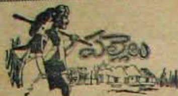
(5 వ పేజీ కొరవ)

కొణనుండి అర్ధం చేసుకోవలసిందని ఆ సొంతాది అధ్యక్షుణ్ణి కోరుకున్నాము.