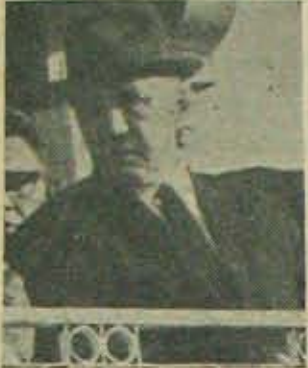
రష్యా ప్రధాని కొసిగోవ్ విమోచనమే?

అందుబాటు. అయితే భాగంలో గత దినములలో భాగ్య గాదిందిన చర్చలంత క్లిష్టమైనవిగావీ చర్చలని అంటున్నారు. భారతదేశానికి అయిదాల నష్టం అధికంగా అమెరికా చేయడంలేదు. అంతే గాక చైనా-ఇండియా చైరువ్యం నష్టం. చైనా - పాక్ మైత్రీవంటి క్లిష్ట వ మ న్య