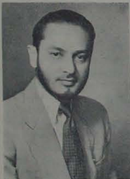
జాతీయ ముస్లిం ప్రంబేర కరవున చూ. 2532 లు వనసాలచేసి రివెన్యూ మంత్రి సమర్పించారుకూడా. ముఖ్యమంత్రి గి లేది జిల్లా కాంగ్రెస్ అధ్యక్షాని శ్రీ ఉస్మాన్

అలస్యంగానైనా నెల్లూరు ముస్లిం సోదరులు నరలు, సహచరాలు జరిపారు. ఈ వక్రంకోటిలో రెండు ముస్లిం నరలు జరిగాయి. నరం నిర్వహణ ఎంతో సుండుగా అక్కరవలసి వుండవచ్చి. గతమాసం 23 తేదీన నెల్లూరు జేషన్ల ముస్లిం ప్రంబేర శ్రీ జిమ్ కె ప్రకృతి అధ్యక్షాని జిల్లాలో పెద్ద యెత్తన సభ జరిగింది. అనాడు జిల్లాలో జనం ఓటికిలారాడు. అనంద ర్పంగా దేశ రక్షణనిడికి సింహపురి