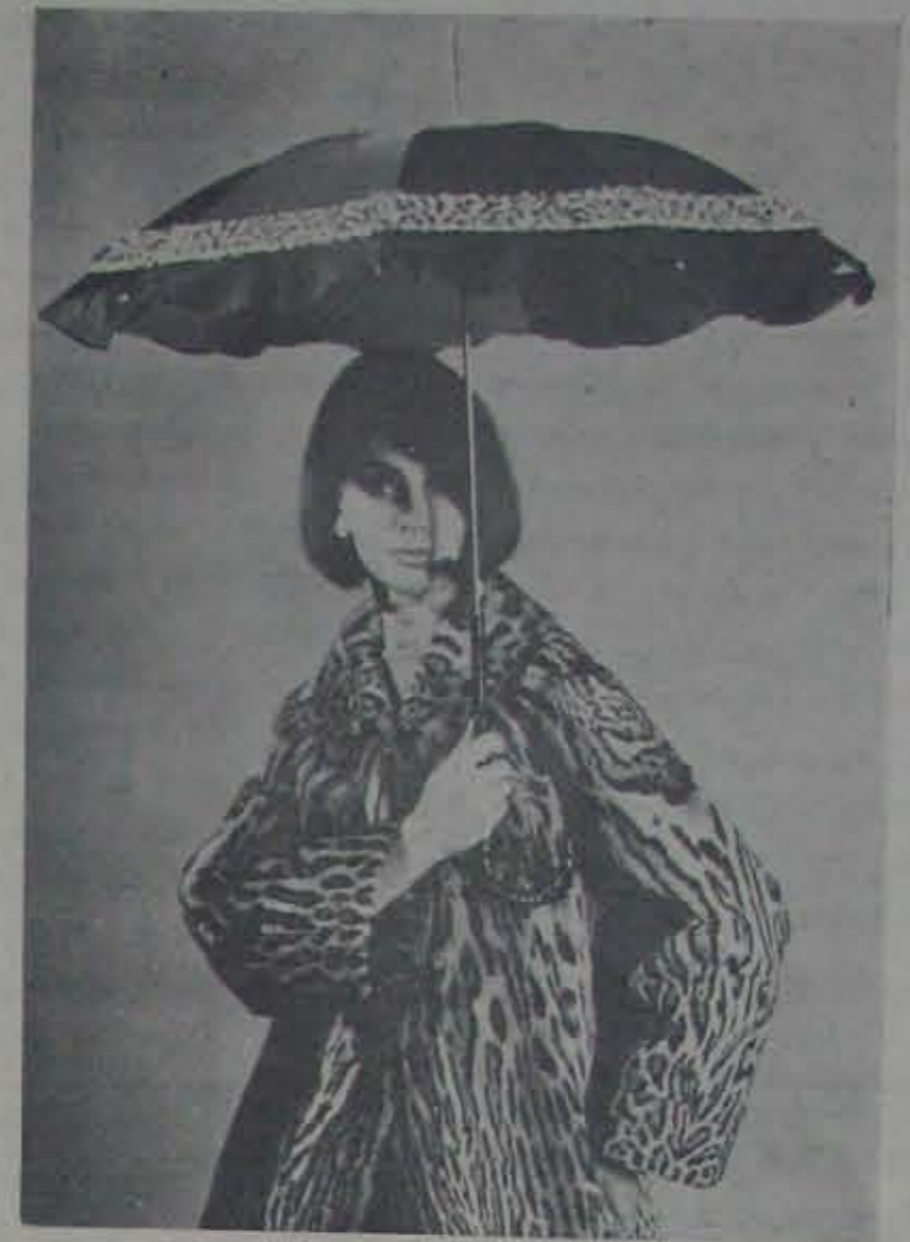
అర్జుణవనితల నాగరికతా విన్యాసం. బొంబాయి తోలుబొమ్మయేరాదు, గొడుగుకూడా ఆ తోలు అలంకరణ!

హదీస్ ముఖర్రి చెప్పిన సామ్యాన్ని వుదహరిస్తూ అందరిమందిగా గాఖండా ముస్లింలు మరణించినప్పుడు గి అడుగులు