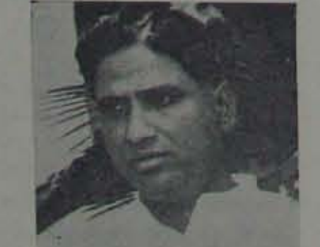
యంలో. కాని యితర స్వైచ్ఛేమ పరిశ్రమలకు మాత్రం యింతైనా సహాయం చేస్తూ వుంటాయని ఆర్థిక మంత్రి చెప్పారు. స్టేట్ బ్యాంక్ ఆఫ్ హైదరాబాదును స్థాపించి, పోషించి, దానికి ఆర్థికంగా అన్నిహంగులను కల్పించి మాత్రమే హైద

రాబాదు రాష్ట్ర ప్రభుత్వం. ఆంధ్ర ప్రదేశ్ యేర్పడిన అనంతరం, దీన్ని ఇతర మాజీ సంస్థాన బ్యాంకులతో సహా, స్టేట్ బ్యాంక్ ఆఫ్ ఇండియాకు స్వాధీనంచేశారు. అప్పటినుండి దాని పర్యవేక్షణ క్రిందనే ఇది వని జేస్తున్నాయి. అయినా స్టేట్ బ్యాంక్ ఆఫ్ హైదరాబాదు, రాష్ట్ర ప్రభుత్వ అవసరాలను తీర్చలేకపోవడం తోచనియం దీన్ని మళ్ళీ రాష్ట్ర ప్రభుత్వానికి స్వాధీనం చేయమని రాష్ట్ర ప్రభుత్వం శేంద్రాన్ని కోరడం సలబు. లేదా ప్రభుత్వం తన ఆపారమైన శక్తి నంపడతో, రాష్ట్ర సహకార బ్యాంక్ నైనా బలవరది విస్తృతపరచాలి. ఈ సంవత్సరం రాష్ట్ర ప్రభుత్వ బంధంలో కూడా ఈ రెండు స్టేట్ బ్యాంకులు గురుతికంటే బాలాకట్టు వకే పెట్టుటల్ల పెట్టాయుట. పైగా యితర రాష్ట్రాల్లో మాత్రం హెచ్చుగా పెట్టుటల్ల పెట్టాయుట. ఇందు వల్లకూడా ఆంధ్ర ప్రదేశ్ ప్రభుత్వానికి ఈ రెండు సంస్థలైనా బాలాకోవంగావుంది.