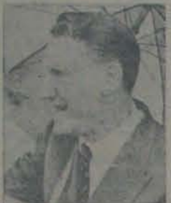
రోడీసియా తెల్ల నియంత వివేకవారి స్వీకృత

గవర్నరు కున (ఇక్బాల్) రాజ్య వాయిదా వ్యాఖ్యానించాడు. ఇటువంటి వ్యాఖ్య వస్తుందని ఆహ్వానించాడు, రోడీసియా