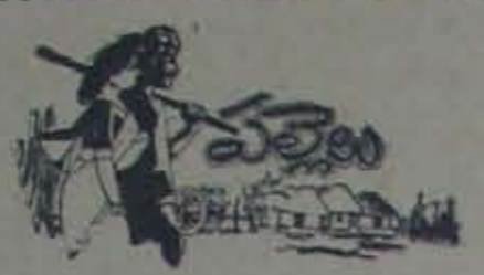
(5 వ పేజీ కొరవ)