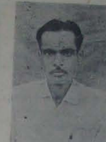
మనులోలు హైస్కూలుకు 2 వలు నిరాశమిచ్చిన పేద అదర్ష బాత

సేవాత్మకు, వినుశ్రీ పూజాదొక డలుకలిగి, దిశ్చక్తితో వలెతున్నా అధ్యక్షం లేని కిల్లా విద్యాశాలాదికారి శ్రీ పి. స్వామి దాన మాట్లాడుతూ ముదివర్రు పాలెం హె