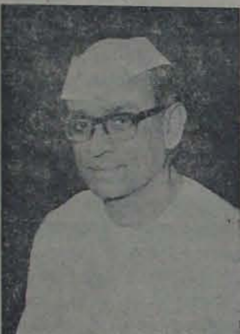
తొలిసారిగా విదేశాలకు పోతున్న శ్రీమంత్రి

అయితే మేము ముందంజ వేసినది కాంగ్రెస్ విజయం అని ఉంది. గత పదిహేనురోజులనుండి ఎంతో తలచావచ్చు, ఎంతో భారణంగా సంగ్రామంలో ముందంజ వేసినవారంతా ముందంజ వేసినవారే కాదు, వాటిని తిరస్కరించినవారు కూడా ఉన్నారు.