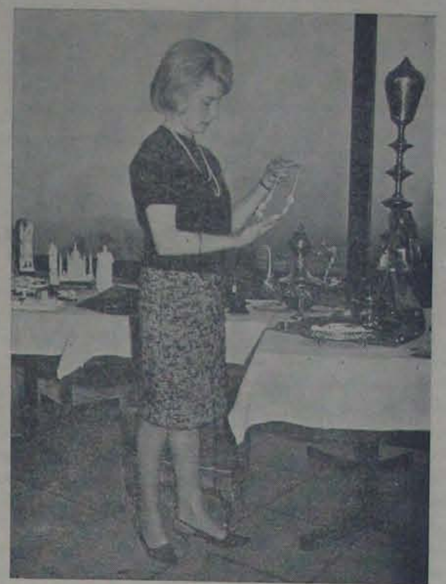
ఇక్కడిలో జరిగిన ఇండియా విగ్రహిణిలో భారతమానవకళల నైపుణ్యాన్ని చూపే వివిధ వస్తువులను పరిశీలిస్తున్న ఇక్కా వనిత

దక్షిణ వీక్షనాంలో రాజకీయంగా లేక మిలిటరీకా రష్యా కల్పించుకోవడం తెలిసినట్లు, అమెరికాలో పలుకుబడిగల 'న్యూస్ వీక్ష' వారపత్రికలో ప్రకటించారు. ఇందుకు ఆధారం? "రష్యా ప్రధాని కోసిగిన్ ఉత్తర వీక్షనాం రాజధాని మానాయలో వుండగానే, అమెరికా దళాలమీద ఉత్తరవీక్షనాం శక్తులు విపరీతంగా దాడులు నల్పినవి. అందువలన, ఉత్తర వీక్షనాం సహాయానికి అంతకుపూర్వం రాబడిన రష్యా ఇకవచ్చి సాయపడదని అయిన తెలియజేసినట్లు వినికిడి. ఉత్తర వీక్షనాం చర్యలపై అయిన చాల ప్రభుత్వే నట్లు తెలిసింది."