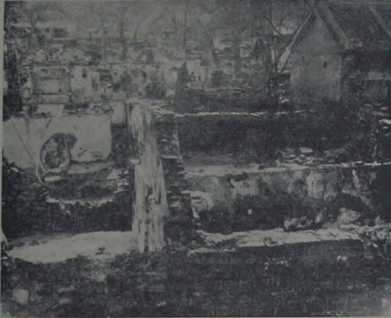
అగ్నిప్రమాదానంతరం శిశుశాలావంటోపున్న సంగం గ్రామదర్శనం.