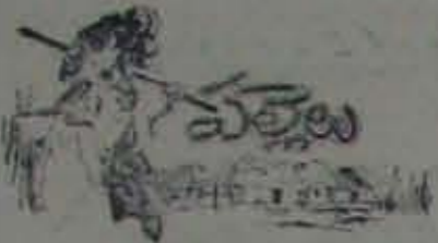
(9 వ కేటి కొరక)