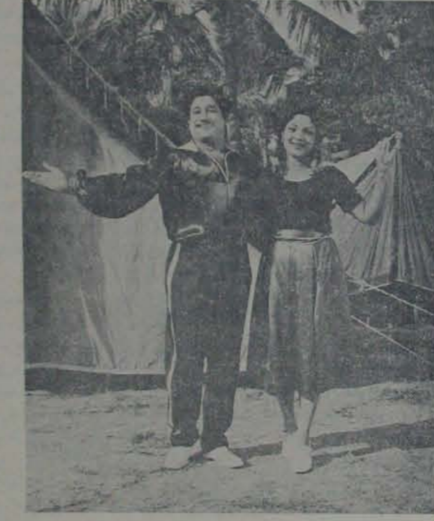
ఈమ ఫిలిం నేవారి 'దైవతాననం' లో శివాజీ గజేకా, దేవిక

"ఎన్నో రంగారావుగారోక జమీందారుడు, కర్నూటుడు. ఆయనకు జమున వేషంలో ఒక కూతురు, రామకృష్ణ వేషంలో ఒక కొడుకు. రామకృష్ణుడు చదువు పేరుతో బస్టికెళ్ళి చదువుకు యింకనామం చెల్ల ఆ కృష్ణ గీతాంజలి వేషంలోవున్న అమ్మాయిని 'పాపాల' నానాదిక విషాదాల-అంటే పాపాలంటి గంతులేయక, సరస్వతీ అలకాలాక్షం వగైరాలన్నీ చేసి, అమ్మాయిని నాగభూషణం వేషంలో