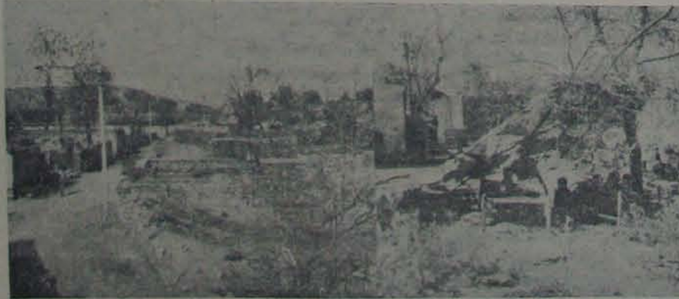
ఎవమవైపుదిశ: అగ్నిప్రమాదానంతరం మొండిగోడలతో, మనుష్యనందారంలేకుండా, నిర్జీవంగావున్న సంగం గ్రామమీది. బుడిచెప్పి: అకులుబూదాలేని చెట్లకింద, రింది సేరిక, అద్యవవలోపున్న ఒక గురువేద దుబుంబ దైన్య దయనీయస్థితి.

The Nedurumalli Balakrishna Reddi SCIENCE & ARTS COLLEGE VIDYANAGAR, VAKADU Nellore Dt. (A. P.) ANNOUNCEMENT.