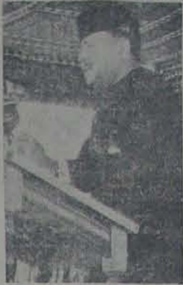
కచ్ ఉప్పుదంతో కాళ్ళిరు కలలు కంటున్నాడా పాక్ నియంత ఆయుబ్ ఖాన్?

వ్యతిరేక ప్రదర్శనలను నిర్దంబేసింది. సంఘమాయకుల ముఖ్యులైనవారు అందులో పాల్గొనవలెనని తీవ్రమైనట్లున్నది. కాని, దురాశ్రమణదారుల దళాలు పూర్తిగా అవలంబితాయి, తదుపరి వీన్నాన్ని పాఠ్యాలను పరస్పర సంవాదంవలసగాని అంతర్దాతీయ