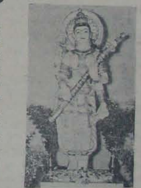
దివ్యసుందరతేజస్సుతో వెలిగే సరస్వతీదేవి పాలరాతి విగ్రహం

గింజగల మందిరాన్ని మాదివుండలేదు. పూర్తి పాలరాయితో నిర్మించబడిన ఈ మందిరంలో, అతి సున్నితమైన కాళ్ళిరు శాలువాలను తలపించే శ్రీ లాస్సు (Lawns) తో ఆవరించబడిన ఈ మందిరంలో దివ్యసుందరమైన శేషస్సుతో వెలిగి పోతూ, కారదాదేవి తన కబాక్ష బీక్షణాలతో విద్యావిహారం సారక నామరేయం చేస్తున్నదా అనిపిస్తుంది. దేశంలో యింత ఆద్యుతమైన దేవతామూర్తులకు దనుకుంటాను. నాకుతెలిసి పిలారిలోని సరస్వతీ విగ్రహంతో పోల్చదగిన సుందర విగ్రహాలు - మదుర మీనాక్షి, దక్షిణేశ్వరంలోని ప్రసన్న శాలి. మరోవిషయం ఆలయ కుడ్యాలపై దేవతల బొమ్మలెకాక మత ప్రవక్తల, శాస్త్రబేత్తల, యుగపురుషుల చెక్కడాలనుంచారు. శాశా తెనెడ