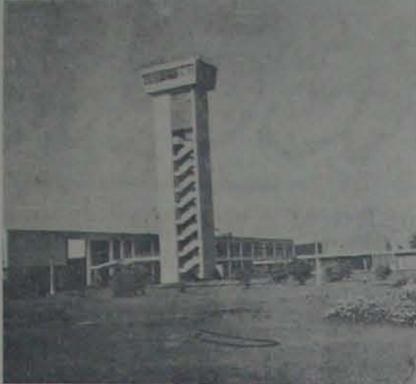
కేంద్రప్రభుత్వం నెలకొల్పిన ఎలక్ట్రానిక్ ఇంజనీరింగు పరిశోధన సంస్థ - (CEERI) - డిలివిజా విషయంలో ఈ సంస్థ యంతో ప్రగతిని సాధించింది

ప్రస్తుతస్థితికి మూలకారకులైన వ్యక్తులనుకలంబవడం నా భర్త మనుకుంటాను. వారు BITS కేన్సన్ శ్రీ. జి. డి. డిర్లా;