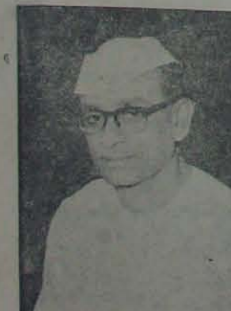
తన ప్రాచారకాచార్యులతో తా సమకున్న తన హయాంలోనే పాశ్చిమ ముఖ్య ఆధ్యక్షులు ఉత్కలమంత్రి శ్రీ నీలం సంజీవరెడ్డి.