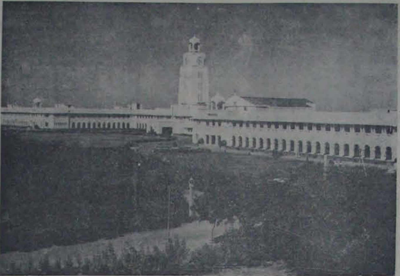
పిలారిలోని విద్యా విశ్వవిద్యాలయ అవ్ బెక్కాలకి అండ్ సైన్సు-సంస్థల దృశ్యం

పిలారి దక్షిణ దేశానికి జమీనరైతులకు గలదు. తమ జన్మభూమిని యాచార్యులతో దేశానికి విద్యావిషయ ప్రసాదించేస్తూన్న ఒక సరస్వతీనిలయంగా మలచడంలో విద్యాల ప్రతినిధులైన బెదార్యం, కార్యదీక్ష, దక్షత యిత్రేణా ముచ్చటగవి. 1901 లో బాక ప్రాథమిక పాఠశాలతో చర్లనదిట్ట,