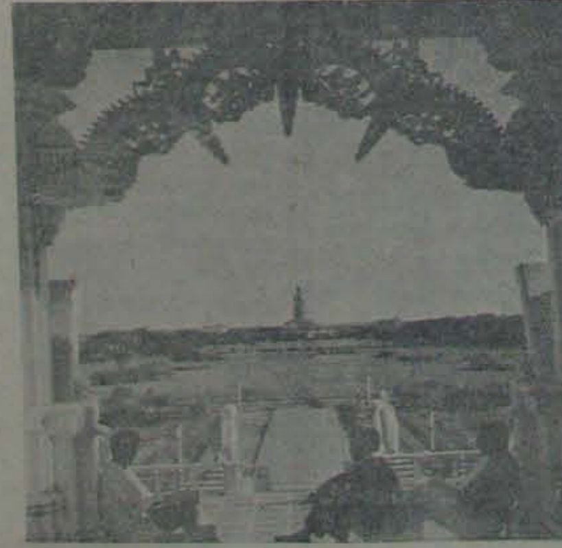
సరస్వతిమందిరంనుండి కనుపిస్తున్న విద్యార్థిసంస్థలు

చెప్పదగిన మరో చిన్నవిషయం పిలనీలోవున్న ఆంధ్రులందరు కలసి విచ్ఛిన్నమవుతున్న సమితి. ప్రతి ఏ దూ సమితిలో యాభైమందికి తక్కువలేకండా సభ్యులు వుంటారు. వందగ నంద యలలో అందరూ ఒకపోటువేరి వూటా వునుస్కారాలు జరువడం, దిందులు చేసుకోవడం, ఏళ్లకోవంటివి ఏర్పాటు చేసుకోవడం వంటివేకాక, ఏడాదికొక ప్రాకవ్రతికను "చారిత" అన్న పేరుతో వెలువరించడం సమితి నిర్వహిస్తున్న చక్కటి వసులలో ఒకటి. హారతిలోని కవనలు విద్యార్థుల కవనలే ఆయనవచ్చుటి మంచి స్థాయి గలదిగానేవుంటున్నాయి. ఇటీవలి ఆంధ్ర విద్యార్థులకు కొంతకొంత Homely Atmosphere కలుగలేదుకం, ఇటీవలి ఆంధ్రోపరులకు ఆంధ్రుల సంస్కృతిని తెలియజేయడం సమితి ముఖ్యోద్దేశ్యాలుగా పేర్కొనవచ్చు. సమితి సభ్యులు ప్రో గు చేసిన విరాళాలనుండి యితటి Central library లో దాదాపు రూ 2000 లు చేసే తె సు గు వున్నకాలు రూడ పొందుపరువబడినాయి. అంద్యేతర ప్రవేశాలలో యిటువంటి సమితుల ఆవశ్యకత ఎంతెనా వున్నదనవచ్చు.