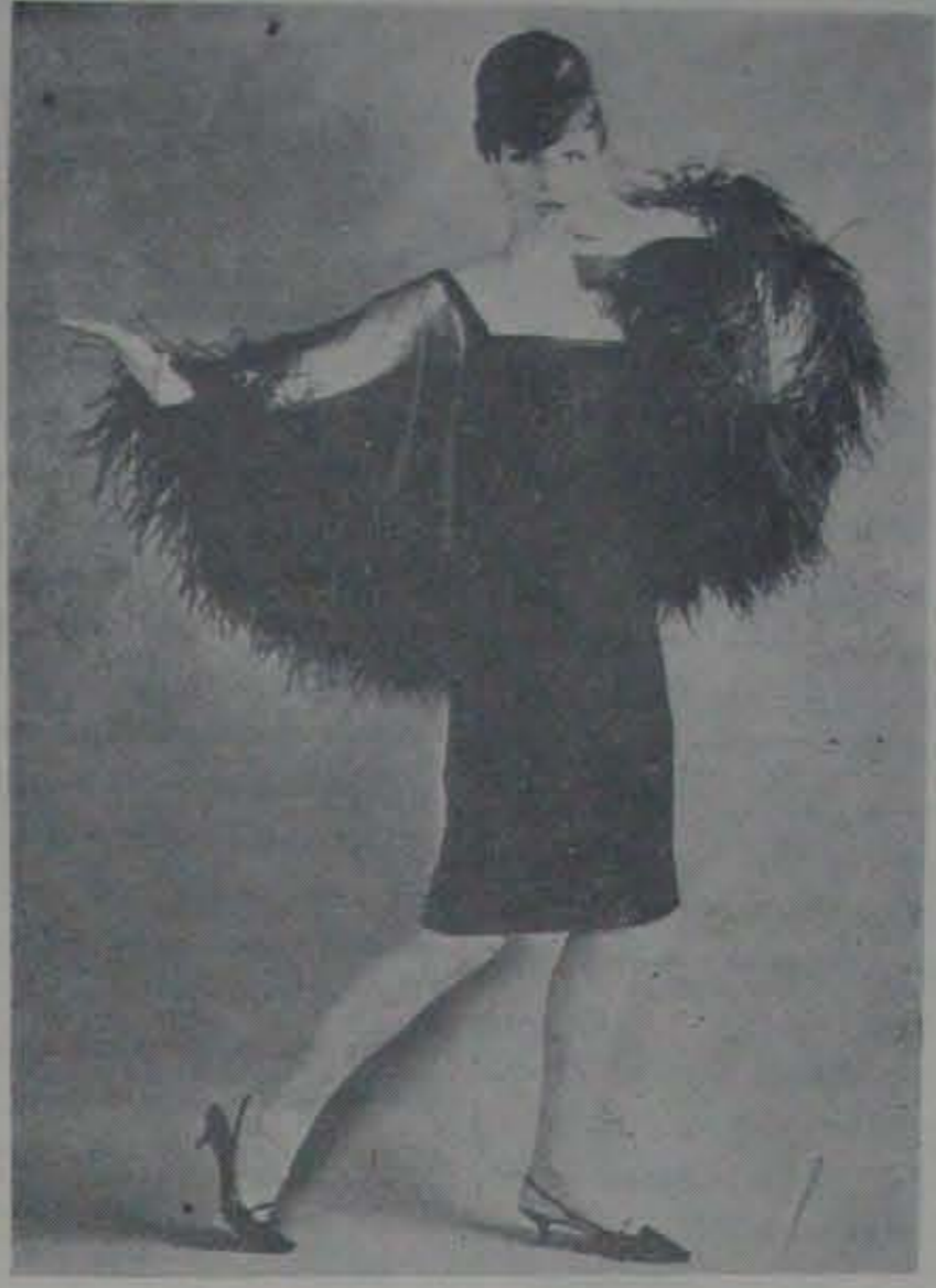
మహిళల వేషధారణలో వర్షం జర్మనీ కొత్తపుంతలు తొక్కుతున్నది. ఉష్ణవర్షి-ఈకలతో తయారుచేయబడిన కోటును తొడుక్కున్న ఒక సుందరాంగి.