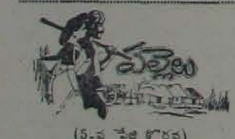
(5-వ కేటి కొరవ)

సుందరయ్యగారు మనీగవున్నట్లు వ్రాసినాడని వరకవింప, యిందియాలా మంతుల్ని లాభములేదు సూతుగావు, వైసనాపాదా!