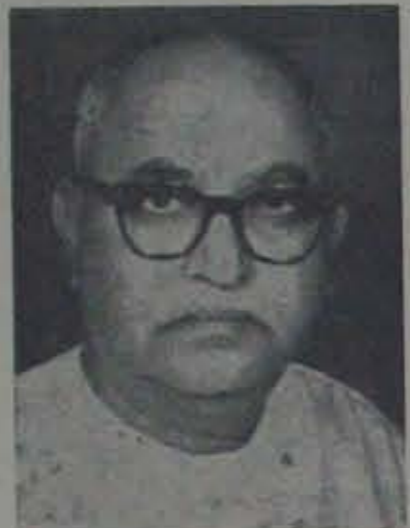
గోవా సమస్యను గొడవచేసిన మైసూరు ముఖ్యమంత్రి

యేండు గడదినవి. ఈ కాలంలో చేశాం కోసం, స్వేచ్ఛకోసం, దుష్టశక్తులను విరోధించి పాపాదన నమయం లేదుగదా! తన యుద్ధకాలంకేత ప్రవృత్తులకు వికారతవ్యవస్థను రాజీయంగా రూపొందించిన స్వచ్ఛమైన, రాజాశ్రయం, ముఖ్యమైన అంతమేమనగా: స్వేచ్ఛను ప్రేమించేదేశానికి ఆవనరమైన యుద్ధాలో చన నవ్వంగా చేస్తున్నామా?... మనరక్షణ విధానంలోని ఉష్ణవక్షిణతవ్యవస్థను? శ్రీ కె. యం. మున్నీ (కులవలెం నెం. 340, 18 జులై 1965 'భవన్వీక్షణలో')