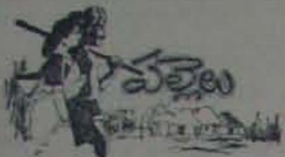
(5 వ పేజీ కొరవ)

అవరణను గుర్తించి, దిబ్బాలో వుండిన ఒక శ్రీ దిబ్బావరణం అన్నది... ప్రమాదాన్ని తప్పించుకోవడానికి ప్రయత్నించండి.