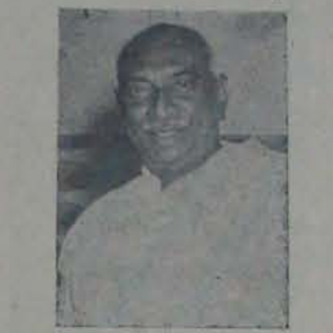
పెట్టికాయితో గురి పిచ్చి కుడరదన్నట్లుగా ఆంధ్ర ప్రదేశ్ లో పరిశ్రమలు కావాలంటే, కడకు కేంద్రం పరిశ్రమలు పెట్టాలన్నా కూడా విద్యుత్తు పుండా అని అడుగుతున్నారని చెప్పారు. ఇంజనీర్లు సరిగా పనిచేస్తే

నవాయుడేయాలి, అట్లా అన్నగారైన కామరాజ్ తమ్ములైన ఆంధ్రులను బీజాపూరు ముందుకు తీసుకొనిపోవాలన్నాడు. పి.సి. విజ్ఞాపనం, నంతోపాటు ద్వితీయ ప్రకటనలు గడచిన యి