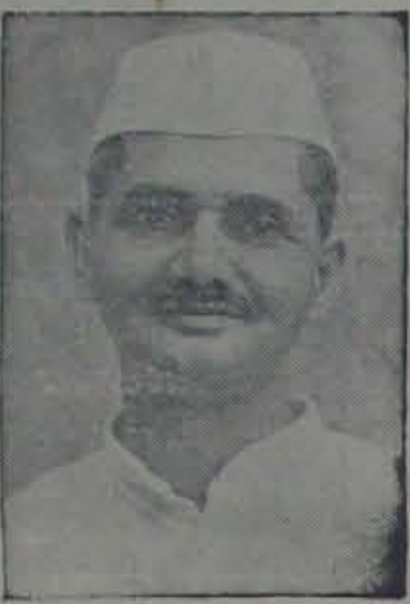
భాగ్యకాలి శ్రీ శాస్త్రీ మహానరకాన్ని జాన్యూ తారవిడువ రాడు."

ప్రకటనలకూ, ఆమెరికా ప్రభుత్వ నీటి ఎండుకనో ఒక తెలుగు యేర్పడింది. అందువలన, రష్యా వితిలేక యిదవవారి కూటంలోకి లాంఛనప్రాయంగా యాద్య బడినది.