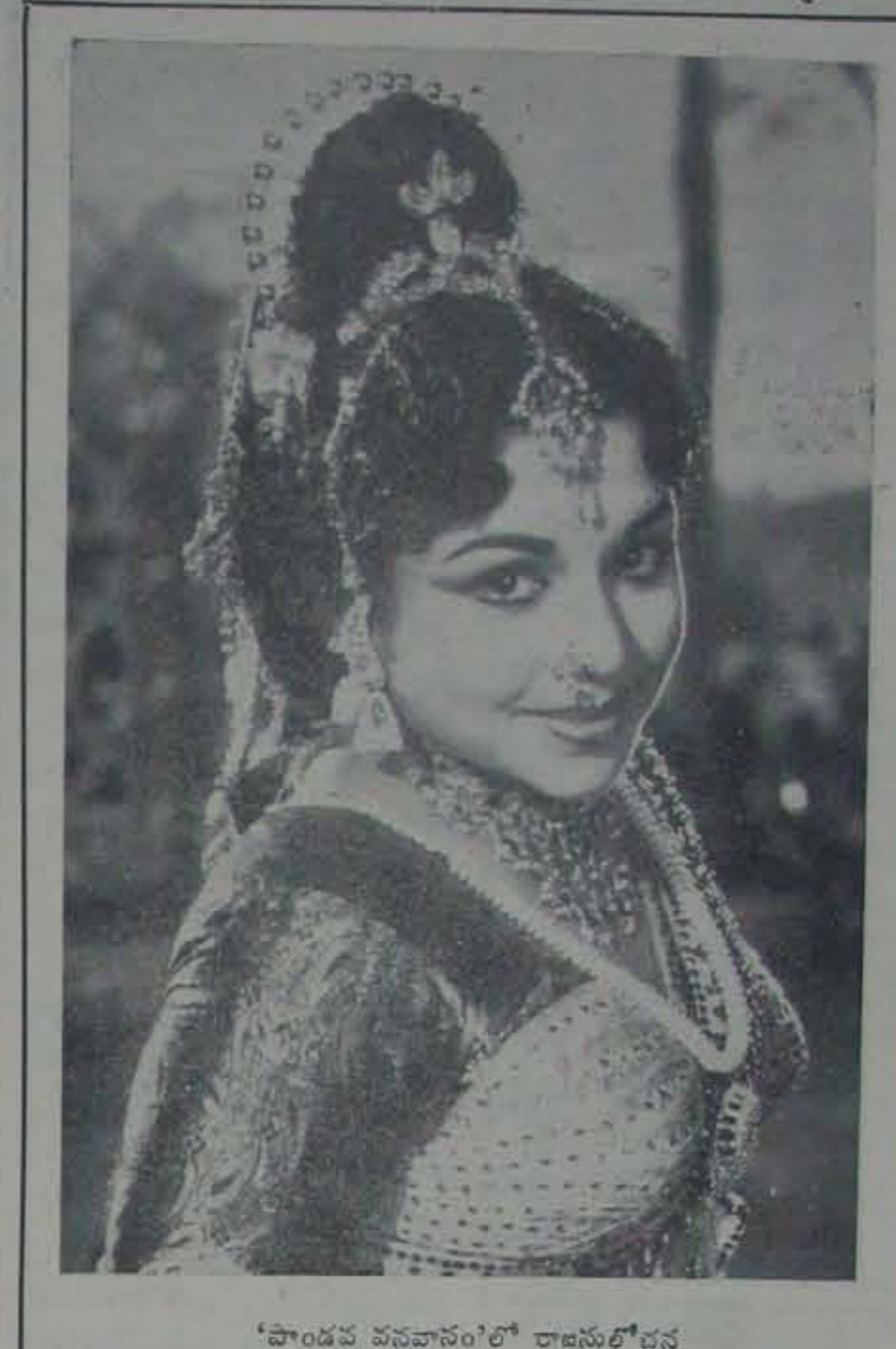
'పాండవ వనవాసం'లో రాజసులోచన

కమ్యూనిస్టులు చట్టవిరుద్ధమైన సాయుధ పర్యలకు పూనుకుంటున్నారన్న సమాచారం ప్రభుత్వానికి లభించడంవల్లనే వామ పక్ష నాయకులమైన కమ్యూనిస్టుల పర్యను తీసుకున్నారు. వారందరినీ కైళ్లలో పెట్టారు. కాని ఇంతమాత్రంతో ఏమవుతుంది? ప్రజలతో కమ్యూనిస్టులకు కల సన్నిహిత సంబంధం, వారిరహస్యమైన ప్రచారవిధానాలు అనలే నిస్పృహకులోనై చేతనారహితమైన ప్రజల్లో మరింత కమ్యూనిస్టు అనుకూలమైన వైఖరి కలగడానికి తోడ్పడుతుంది. దీనికీవ్యతిరేకంగా కాంగ్రెస్ వాదులు రాజకీయంగా చేస్తున్న ప్రచారం కాని, దేశభక్తి ప్రబోధంకాని ఏమీలేదు. అసలు వారికి తిరికమాత్రం ఎక్కడుంది? — కొరవ 7.వ కేటిలా