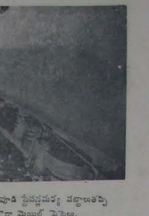
14 తేదీ రాత్రి మనమంత్రి-కొమ్మలపూడి సైవస్వమయ్య వట్టాలకువచ్చి ఒరిగిపోయిన మద్రాసు-హోరా మెయిల్ పెట్టెలు.

పాఠశాలగిలుకులు భార్యలకు వుట్టిరూ 530 ల వరకు ఎగతాకింది. క్రొత్తభార్యలూ 415 ల మొదలు 425 వరకు వున్న దంటున్నారు. క్రొత్తభార్యల, ఎక్కువగా మార్కెట్ కుమినగారి తెలియదు. ప్రజలకు నిత్యసంసారములైనవివల్ల, వున్నవలూకూడా మూడునాలుగురెట్లు పెరిగిపోయాయి. దావంబుడా ప్రాణాలనిల్వకోవడం ఎట్లా అనే ప్రజలను నేడుపిడుకమన్న సమస్య. ప్రభుత్వం ఏం చేస్తుందో, వేదాసాధా ఎట్లా ప్రకారంలో మరి!