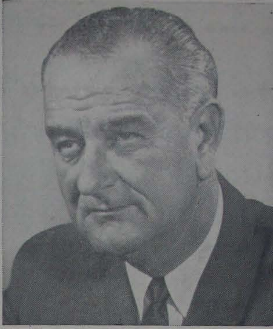
36 వ అమెరికా అభ్యర్థకుడు జనవరి 20 తేదీ ప్రమాణ స్వీకారంచేసిన శ్రీ లిండన్ బి. జాన్సన్

ఇంకొకటి ఈవిషయమై పొర్చుగల్ దేశం (కాంగోను) ఆయనయొద్ద నంబేవం లోని అంతాళాలు గమనించదగినవి: 1) దాలకట్టు వ అదాయంగల కుటుంబాలకు చెందిన బాలబాలికలకు, ఒక్కలాదిమందికి, ఇప్పటికంటే మందివిద్యను యిప్పించడం. 2) విద్యాసౌధనాలు, ఆ విప్రాయాలు, సూక్ష్మపద్ధతులు- అన్నీ అందరికీ అందుబాటులో ఉండవలెను. 3) అధ్యాపకుల శిక్షణను పెంచడం. 4) భద్రమనెక్కుకునే ప్రతిస్థాయిలో ప్రోత్సాహాలను కలిగించడం.