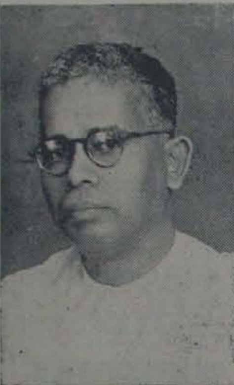
సంకటనను గురించి, తన జాతీయ విధిని నిర్ణయించిన మద్రాసు ముఖ్యమంత్రి శ్రీ భక్తవర్షం.

వారా? లేదా? అప్పుడు మనకు దాని మంది- అంగ్రేజు అధికారావకంగా వ్యవ వలెననడం తప్పకగా!- అమోఘం చెల్లు బడినట్లుంటే- అని. అప్పుడైతే వినో బాజీ సూచించిన రాష్ట్రభాషగా హిందీని గుర్తించడానికి అంగీకరించిన వంగ అని వ్యవహారం చేయాలి. హిందీని గురి వలెననడం!