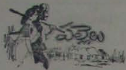
(5 వ కేసు కోసం)