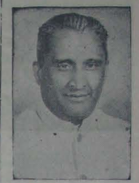
శ్రీ పాటిల్ గారు శుక్రవారంనాడు రైల్వే బడ్జెట్ ప్రతిపాదించిన మంత్రి శ్రీ ఎస్. కె. పాటిల్

ఇట్లావుంటే అర్థికమంత్రి శ్రీ బి.టి.కె. లోకనథకు సమర్పించిన ఆడిట్ నివేదిక మరో ముఖ్యవిషయాన్ని సూచిస్తున్నది. రైల్వే ప్రయాణీకుల సదుపాయ, సౌకర్యాల అభివృద్ధికిగాను చేసిన కేటాయింపులను సరిగా వినియోగించుకోవడంలేదని తెలిసింది. ఈవట్టై యేడాదికి క నీ సం 3 కోట్ల రూపాయలు ఖర్చుపెట్టాల్సివుండగా దానిలో కొంతభాగం వృధాగా మిగిలిపోతున్నట్లు ఆ నివేదిక తెలుపుతున్నది. అంటే రైల్వే ప్రయాణీకుల సౌకర్యాలంటే రైల్వేకోర్టు వారిద్దట్టే ఇట్లావుండన్నమాట. అట్టినే బకా యల వసూళ్ళు వగైరా కొన్నివిషయాల్లో జరుగుతున్న లోపాలనుకూడా ఆ నివేదిక అట్టయలుచేసింది. రైల్వేవారు పోక ప్రధానవిషయాన్ని గమనిస్తున్నట్టులేదు. కొత్తరైలుబంధుమెన్ని వేసినా (అట్లా చేసిందిలేదుగాని) రైల్వేలో క డ్ల త గ్గ డం లే దు. దూరప్రయాణాలను మాత్రమే దృష్టిలోవుంచుకొని యా బం ధును పెంచున్నారు. బాట్లోను జనం క్రిక్కి రిస్తే ప్రయాణాలుచేస్తూ కూర్చోడానికూడా కోటులేకుండా నిలబడి ప్రయాణం చేయ వచ్చికావడం జరుగుతున్నది. శ్రీ పాటిల్ సార్వమంబు ప్రసంగాన్ని బట్టి నూటికి 70 మంది 50 కోట్లమీదకోట్ల ప్రయాణం చేసేవారని స్పష్టమవుతున్నది. అందువల్ల యే యేర్పాట్లుచేసినా యా అధికసంఖ్యా కుల సౌకర్యంకోసం, తక్కువనూరాలు సడిచే రైళ్ళను యెక్కువచేయడం అవసర