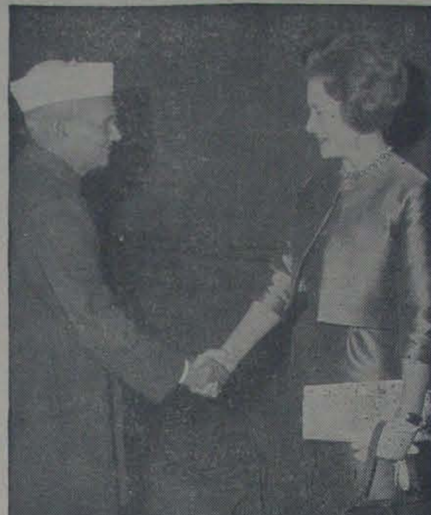
అవినీతి భారతదేశాన్ని సంకల్పించిన బ్రిటిష్ మంత్రికి శ్రీమతి ఐర్యారాజాజీల్ తో ప్రధాని శ్రీ లాల్ బహదూర్

ఇకపోతే చట్టం, లోహియా సూచన లన్నవి. లోహియా సూచనను లోగడనే వివరించి, దాని పై వ్యాఖ్యానించినాము. భాషాభవనామకంలో, అధికార-జాతీయ భాషల విషయంలో, అధియే ఉత్తమమైన