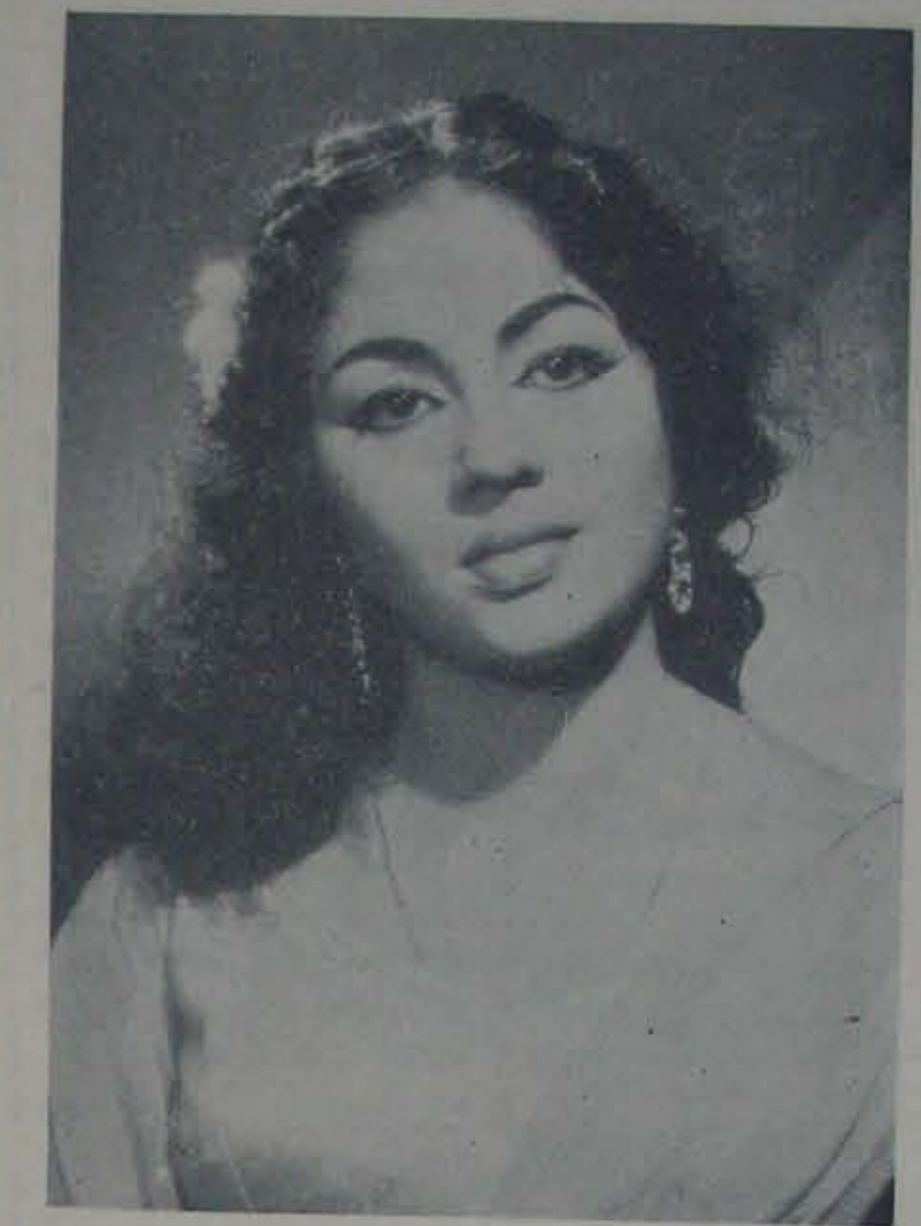
'తనమనసులు' లో క్రొత్త తార నుకన్య

పొత్తులేదు. ఎవరిదారి వారిదివలెవుంది. కనుక మూలీభావం వహించడమే వుధిక ఘన లచ్చన్నగారు బాపిందివుంటారు. తెలుగుభాషను ప్రవేశపెట్టే కార్యక్రమకూడా చురుకుగా కొనసాగిస్తామని ముఖ్యమంత్రిగారు ప్రకటించారు. ఇందుకు ఆవసరమైన చట్టాన్నికూడా ఈ సంవత్సరంలోగా చేస్తామనికూడా చెప్పారుకనుక, బాపాదిషయమై ప్రభుత్వం అంతగా విష