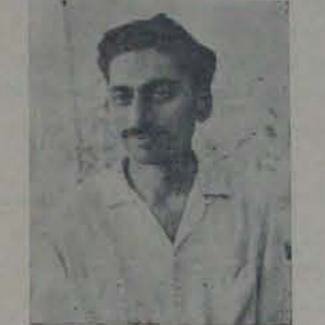
అవిశ్వాసంకంటే ఐక్యతే గౌరవం

యువరాజాలతో రామవరెడ్డి సీరిపో యాడు. ఇది అందరికీ తెలిసిందే. అంతే