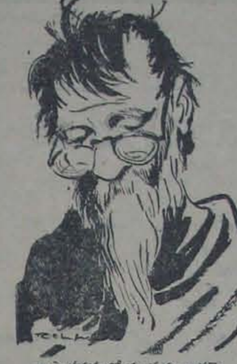
బాషాగడలతో హృదయంబారమై అరుకోబలపాటు ప్రాయోపవేశం చేసి విరమించిన అచార్య విజయభాషే

లిస ప్రసంగాన్ని హిందీలో పూర్తిచేశారు. రాష్ట్రవతి వందల సంఖ్యలలోని ముఖ్యమైన, నృప్తమైన అంశాలను; అధికారభాష విషయంలో శ్రీ నెహ్రూయిచ్చిన హామీలను ప్రభుత్వం ఎట్టి మినహాయింపులూలేకుండా దిక్కుతట్టి అమలుజరుపుతుంది. హిందీ భాష యూనియన్ అధికారభాష అయినప్పటికీ హిందీభాషితరులు కోరింతవరకు ఇంగ్లీషు నమాభాషగా కొనసాగుతుంది.