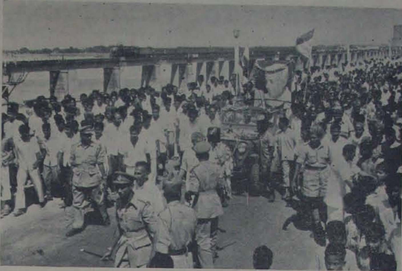
'జనహర్ ఘోషి' కి 12 రేపి నెల్లూరు పెన్నానదివద్ద స్వాగతమిచ్చి వుత్సవంగా సింహపురికి కొనితెలుగుతున్న దృశ్యం.

దానికి రష్యా పూనుకున్నది. అంతేగాక ఉత్తర వీత్ నామ్ అధిపతి హో-షి-మి టోగోగోక హేతువుచేత చైనాపిడిలిలో తా నుండిపోయిన వట్టతిలోనుండి విముక్తి పొంది, ఇతరమైన ఎర్రటి రాజ్యకూటమి లోకి తిరిగిరావలెనని తావశ్రయపడుతు న్నాడు.' రష్యా అమెరికావర్తను అందించిన వదములలో ఒకటి-రెండు కఠినమైనవిగా పున్నప్పటికీ, ఆ ప్రకటన శీవలం హెచ్చ రిక. అమెరికాతో సఖ్యతను పెంచుకోవలె