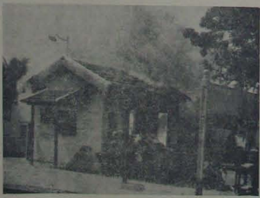
గుమ్మ పెట్టెలది దహనమవుతున్న నెల్లూరు సౌల్ స్టేషన్

ఈ కల్లోలం సందర్భంలో 90 మంది అరెస్టుగావించబడి వారిపై కేసులు రిజిస్టరు చేయబడినట్లు తెలుస్తున్నది.