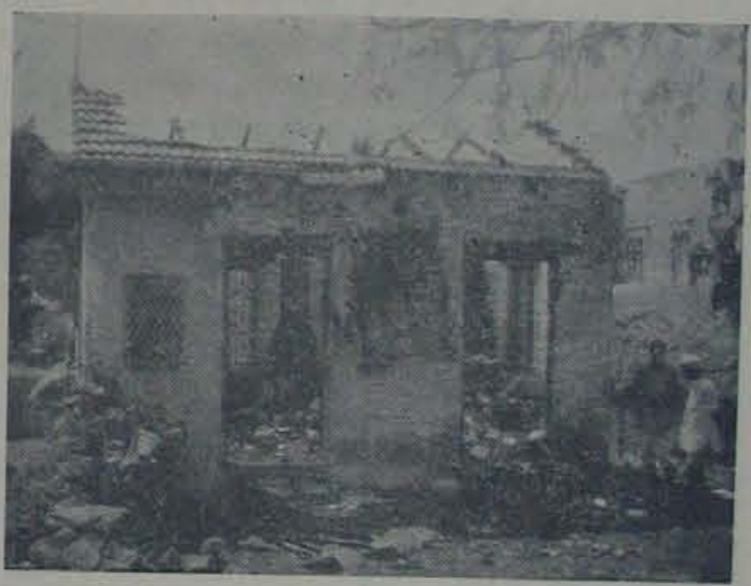
దహనానంతరం సౌల్ స్టేషన్ లిడిల దృశ్యం.

లేకుండా చేయుటకా అన్నట్లు జనవికీర్ణమై వువయం పరిస్థితిమాస్తే మాత్రం ప్రశాంతంగా గడచిపోగలదే మోసనిపిడింది. కాని యిది పొరపాటుపూహగా, కోరుండా ఎప్పుడూ పోకపోయినా, 15తేదీ