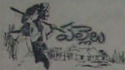
(5 వ పేజీ కొరవ)

తెలిసిన వాస్తవ పరిస్థితి. గతవారం వార్తలోని విషయాలను వివరించినది. ఈ సవరణను గమనించవలసిందిగా పాఠకులకు మనవి.