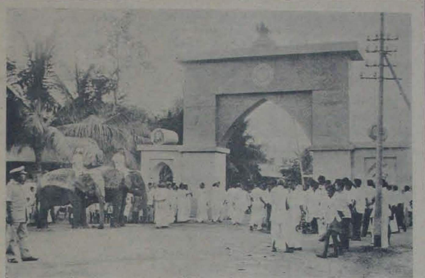
నెల్లూరు దొడ్ల కొనలయ్య ప్రభుత్వ మహిళా కళాశాల ప్రారంభోత్సవ సందర్భంగా కలెక్టరు బంగళారోడ్డు క్రంకు రోడ్డులో శ్రీ శ్రీ సోపా నిర్మించబడిన హూరి ప్రవేశ ద్వారం.

మాడవనాడుమాత్రమే రూ. 40,000 అర్బుతోజరిగిన ఈసభలో పాల్గొన్నవారు కొన్నిసార్లుకూడా, సభ్యులూకూ రాగలిగారు. వారు ఆహూదించిన తీర్మానాలలో కూడా సాంస్కృతిక ప్రభుత్వంలోపం, దేశ