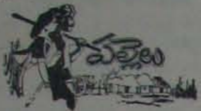
(3 వ కేటి కొరవ)

చేతలు కాని, కడకు గణపతి పువనంపా రింబుకోగా, మస్తాకార్థి ఏకగ్రీవంగా ఎప్పుకోవడం.