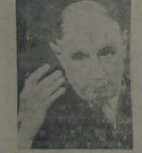
ఫ్రెంచి నియంత దీగార్

అమెరికాలో దీకొంటు, చైనా మహాదానం దాన్ని పొందుతుంది. ఇక, ఒక గొప్పకోశ్యం ప్రకారం అమెరికా-రష్యాలు క్రమేపీ ఒకదానికొకటి సమీపంగా వస్తవిగాని పెట్టనంతుర్ల అటగేపు.