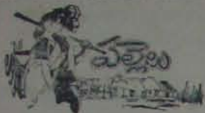
(5వ పేజీ కొరవ)

గుడ్లలు, వేంగరాలు, బంగారుబండలు, గడియారాలు వగైరా దొంగసొత్తులు దొరికినట్లు తెలుస్తున్నది. ఈ దొంగలు ముగ్గురు. వీరు ముగ్గురు దొంగలొంకలో వాకరూతుకుకొని, ఆహారవస్తువుల విశ్రాంతి తీసుకుంటుంటారు. వాళ్ళ రూములో మొదటి, రెండవతరగతి రైలుపెట్టెలలోని వస్తువులు, ఇంకా కొన్నివస్తువులు వున్నవట. ఈ దొంగసొత్తుల విషయం యింకా దర్యాప్తు అధికారులకు తెలియదు. —జ. వి.