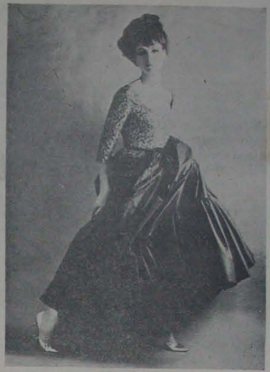
ముఖ్యమంత్రి కుస్తులలో ముదితలు ముచ్చటగా కనబడతారని వర్ణించు జర్నలిస్ట్ 'డిజైనరు' కాలేజీ అమ్మాయిలకోసం ప్రత్యేకంగా కాయాచేసిన 'ఉవెరింగ్లెస్'