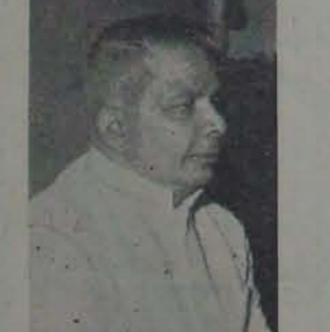
గోవా ముఖ్యమంత్రి మనూరాష్ట్రీవారి శ్రీ బందోద్కర్.

అక్రీ, ప్రజాస్వామికం - సోషలిజం - ప్లానింగ్ అనే అంశక్రయమీద రాజాజీ పక్కని విమర్శనాత్మక విధానాన్ని అవ