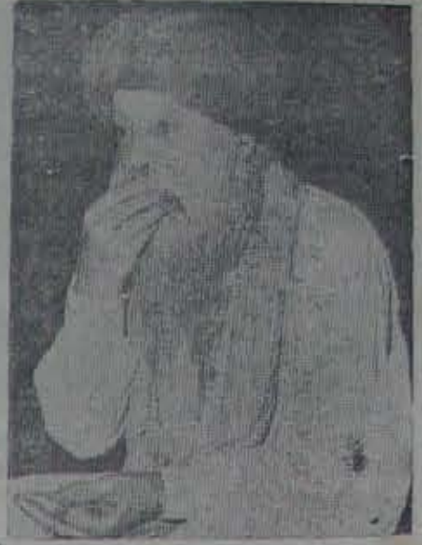
మరలా స్వయంప్రకాశనం కావాలని లేవడమను తారాసింగ్.

కొరవ. నాల్గవ ప్రజాసౌకర్య ముసాయిదా ప్రవచనం వేదనలోవున్నది. గడచిన మూడు ప్రజాసౌకర్య కలిసిన మొత్తంకంటే యెక్కువ మొత్తంలో నాల్గవ ప్రజాసౌకర్య కమన్వేషణలని ప్రభుత్వసంకల్పం. అందుకే నాల్గవ ప్రజా సౌకర్యకమన్వేషణలతో బాధపడుతున్నది. ప్రజాసౌకర్య అధికారిగాకాక, అధికారం సాధ్యంగా; శక్తి మందికాక, మన వనరుల పరిమితికి లోబడివుండాలని ప్రభు త్వాధినేతల అలోచన. అసలు ప్రజాసౌకర్యం కొంత విస్తారం యివ్వాలని కొందరి