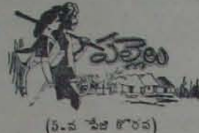
(5-వ పేజీ కొరవ)

వట్టినాపెట్టి పట్టిలాదాము అమలువేరే సలుడు అదిలోన, చర్చరాజా తిరిగి దావానవేరందారు, భారతియ్యి వారి భారసులుగ!