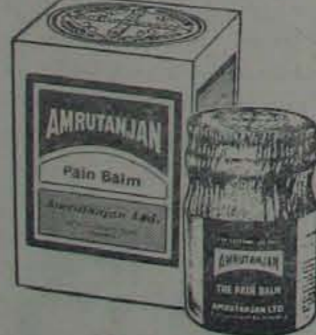
అమృతాంజన్ క్రొత్తగా ఉద్భవించిన ఉత్పాదం. వీసా అంజన్ తో వీర చేయండి ఉంటుంది.

అమృతాంజన్ రిమెడిక్ మైసూరు లోకాలము. కంపెనీ. 100