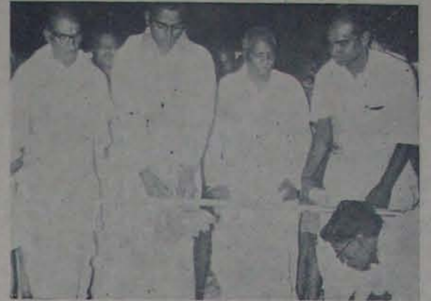
మర్రిపాడు సమితిలోని యేనుగుండ్లపాడు సంఘం ప్రారంభోత్సవం జరుపుకున్న సమయంలో ఆత్మ కూరుకు ఒక అభినవ 'రాయలు' - రేవూరు విద్యుత్పబ్ లో ఉత్సేహ్!

కూడా అమెరికాను పంపారు. ఆది మరీ మా కమ్యూనిస్టు పార్టీ నుండి వెళ్లినవారు అయ్యి రాజీనామా లో వెళ్లినవారు అయ్యారు. ఆ సమయంలో ఆ పార్టీలో ఉన్నవారు అందరూ పనిచేయడం మానేసారు. ఆ సమయంలో ఆ పార్టీలో ఉన్నవారు అందరూ పనిచేయడం మానేసారు.