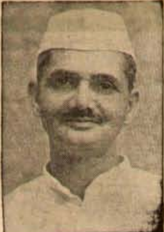
కెయిరో సభలో విశిష్టమైన పాత్రను విజయవంతంగా నిర్వ హించిన భాగవత ప్రధాని శ్రీ లాల్ బహదూర్

అవుహవమైన నెల్లూరు వియ్యాన్ని రాయల సీమ, మైసూరు ప్రాంతాలకు ఎగు మతిచేసి; గుంతకల్లునుండో లేక వేరొక దుారం ప్రదేశంనుండో నాశితకం వియ్యాన్ని దిగుమతి చేసుకోమనడం న్యాయంకాదు. నెల్లూరు డిపోలో నెల్లూరు వియ్యాన్నే అమ్మించండి; వాటికితోడు అమ్మకంలేదీ చౌకరకాలను దిగుమతిచేసి కొనుటకు అనుమతించండి; లై సెన్సు పొందిన ప్రయవేలు వ్యాపారులెవరో, వారికి అమ్మకానికి ఎన్నివియ్యం సరఫరా చేస్తున్నారో, వారు ఏవిధంగా అమ్ము తున్నారో మీరు తనిఖీ చేయండి, ప్రజ లకు తెలుసుకునే అవకాశం కల్పించండి; ఈ క్షిప్త చ రి స్థి తి ని అధిగమించుటకు సహాయపడండి. ఇదే అంద్య ప్రభుత్వా నికి, అహారమంత్రికి మామిట్టి.