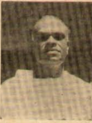
ఆహార మంత్రిగాను ఆలకిస్తారా?