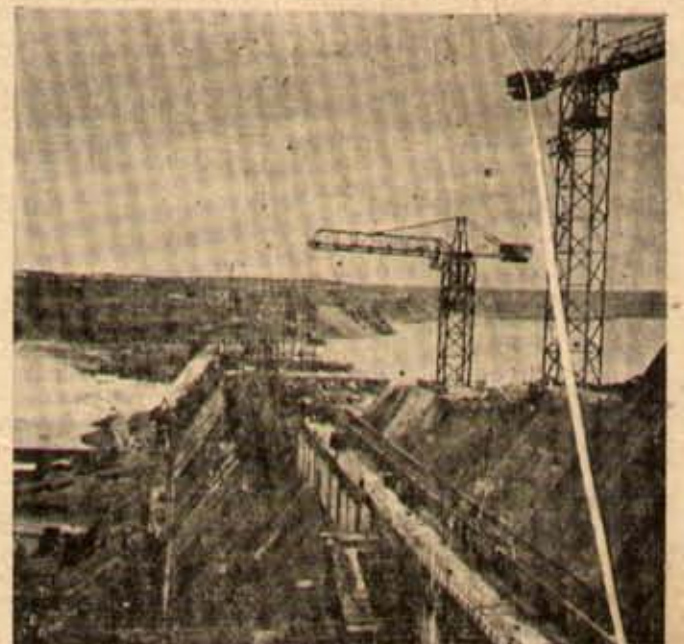
వైకేపున్న నాగార్జున సాగర్ డాం.

కృషిచేద్దాం - ఈ ప్రణాళికా యుగంలో సర్వ సమృద్ధికి పాటుపడదాం.