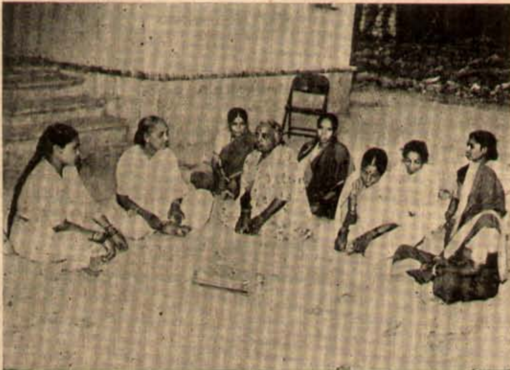
అందరూ మహిళా సభ్యులేగా షావరాబాదు, చెవెళ్ళ బ్లాకులోని మహారాజాపేట పంచాయతీ.