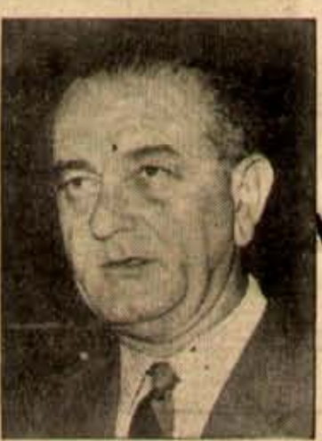
అమెరికా అధ్యక్షుడుగా అఖండ విజయంపొందిన శ్రీ లిండబ జాన్సన్

కేంద్రమంత్రుల విషయంలో ప్రధాని; ముఖ్యమంత్రుల విషయంలో ప్రధాని-కేంద్రహోంమంత్రి; రాష్ట్రమంత్రుల విషయంలో ఆయా ముఖ్యమంత్రులు ఈ నియమావళిని అమలు జరుపుతారు; అవసరమైన చర్యలు తీసుకుంటారు.