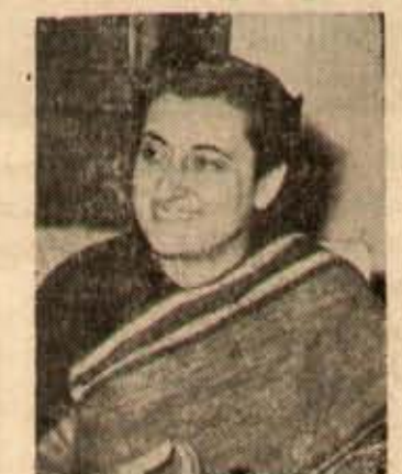
న్యూయార్క్ మేళాలో ఇండియాకు ప్రాతినిధ్యం వహించిన శ్రీమతి ఇందిరా గాంధీ.

రావగా ఈ వద్యరా శాంతి సాధన" Peace through understanding. మనమూ చిన్న సైనిక మేళాలు, సమ్మేళనాలు మాళాం, మననెల్లారుదిల్లపాదులం