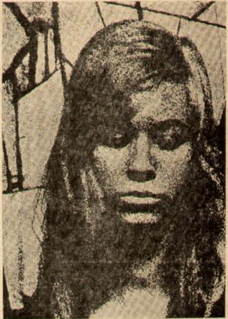
వశ్యమజర్మనీ ఆమెయాల్ పోట్ గ్యారర్డు ఏర్పాటు చేసిన పోట్ ప్రచర్యనంలో ఇంక బ్రాయింగ్ దిక్రంలా కనుపించే ఈ పోట్ తు వ్రతమ జహామతి లలిందింది.

ఈ విల్ల నెగ్గడం, లోగా ఆ ల్రావో లింకన్ సిగ్రో దాన్య విమోచనం కోసం గావించిన ప్రకటన వంటిదని అంటు న్నారు. కెన్నడీ స్మారకస్టూపంలో ఒక స్తూపానికి నమానమైనదిగానూ, రాటోపు ఎన్నికలో జాన్సన్ విజయాన్ని సూచించే వ కా కం గానూ ఇది వెల్లొందునున్నదని