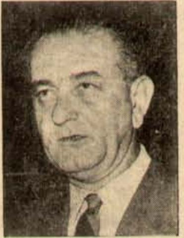
కెన్నడీ వదలిపోయిన వ్యతిరేక కర్త వ్యాన్స్ దిక్షిత్ కు సెలవేర్చిన ఆమెరికా అధ్యక్షుడు లిండన్ జాన్సన్

ఇందులో పేరీ ఒకతావున రావచ్చును. వశ్యమ బెర్లిన్ వశ్యమ జర్మనీలో భాగం కావని రష్యా-తూర్పు జర్మనీలు-అనంది' వక్రంలో వ్రాసుకున్నారు. బెర్లిన్ అంతా తూర్పు జర్మనీ కే చెందిన భాగంగానక తూర్పు బెర్లిన్ గాక పరమతి భాగంగా