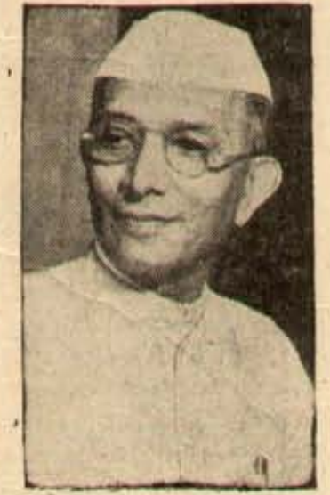
ఆదికారదాహం గలవారికి ఉత్సవ్త మార్గంబూపిన మాన్యుడు శ్రీ మొరార్జీ

సాదింతామని చెబితే జనం నమ్మురు. ఆ గమ్మంలో పీరికేట్ కలిసినచ్చేది వుండ ల్లెట్, దానిని ప్రస్తావిస్తున్నారనే అవ నమ్మకం ప్రజలందు ప్రజలిపోతున్నది. అందువలన, ప్రజలబాధ హెచ్చు కా క మునుపే, దానిని కనిపెట్టి రిక్షిత్ చేయడం అవసరం. ఇదిలేనాడు ప్రభుత్వమెందుకు? ఎట్లయితేనేమి, ప్రభుత్వ ల ప్రజల ఇక్కట్లను ఎట్టకేలకు తెలుసుకున్నవారై, వాటి నివారణకై శ్రద్ధవారిన్నారు. రాన్య డులనవ్వయి, వత్తలల్లి విషయంలో వచ్చిన సమస్యలను పరిష్కరించడానికి యెన్నో విధాల యోచన చేస్తున్నారు.