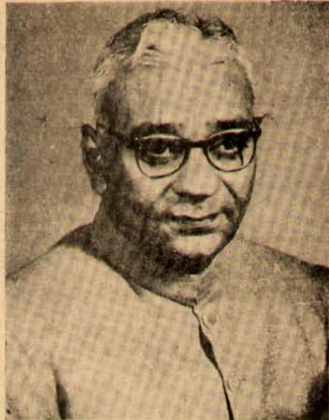
ముఖ్యమంత్రి అత్యున్నత, శాసనసభ కాంగ్రెసు పార్టీ నాయకత్వాన్ని కూడా చేపట్టిన శ్రీ కాసు బ్రహ్మసందర్భి

కాంగ్రెసు నాయకుల ప్రోత్సాహం వున్నవారో నన్ను విషయాన్ని వారు ప్రస్తావించలేదు. అ పంచాయతీ సమితులకు ఎన్నికలు అరిగిన వ్యవస్థ విషయం ఎలావున్నా, అసలు సమితుల వున్నప్పుడు కాంగ్రెసులో చాలా వివాదం వుంది. అందులో అవకాశం కలుగుతుంది. అందులో అవకాశం కలుగుతుంది. అందులో అవకాశం కలుగుతుంది. అందులో అవకాశం కలుగుతుంది.