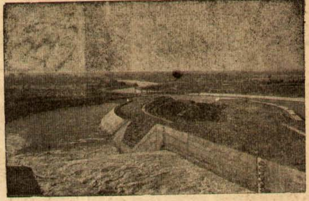
36 అక్షం ఎకరాలకు నీటి వనధిని, 8 అక్షం కి. వా. విద్యుత్ ఉత్పత్తిని కల్పించే బాదా డాంలో ఒకభాగం. బాంగా డాంవద్ద నక్షేట్ ఎడమగట్టునుండి వురకలువేస్తూ ప్రారంభమయ్యే బాంగాలో ప్రాచీన రావలను పై చిత్రంలో చూడవచ్చు.

విక్రలైనాను ప్యాన్సు గుర్తింపడం వలన పాశ్చాత్య ప్రపంచానికి, స్వేచ్ఛను కామించే లోకాలకూ చేటు మూడవద్యు నని అనేకులు భయపడినారు. సుప్రసిద్ధ 'పెండ్రి పత్రిక'వెహించేలో ఒక ప్రఖ్యాత వ్యాఖ్యాత 'పెండ్రినియంత' చర్య చాలా శోచనీయమని తెల్పి, ఇండియాలో విక్రలైనావంటి ప్రభుత్వం వద్దినప్పుడు, ఇండియా - చైనాలకు గల వేదం 'పెండ్రి గుర్తింపడంవంటివారికి తెలిసినవస్తుండని హెచ్చరించినాడు. ఇండియామీదకు వండ యాత్ర గానించిన విక్రలైనా ప్రభుత్వాన్ని ఈ సమయంలో ప్యాన్సువంటి చేతం గుర్తింపడం విజ్ఞానమనిపించింది. కాని, ఈ 'పెండ్రి వ్యవహారం'లో, కిడులో మేంస్ట్రులు, ఒక వింత జరిగింది. విక్రలైనా ప్రభుత్వాన్ని ప్యాన్సు గుర్తింపడం ప్రకటించిన తరువాత 'పెండ్రిలో' హాంకాని 'ఒకటి' జయపడి నది. 'పెండ్రి నియంత' మావోరాజ్యాన్ని గుర్తింపడంతో బంగ్-రై-షేక్ రాజ్యాన్ని విడనాడి నన్నేసని విక్రలైనా ప్రభుత్వ ప్రతినిధి వ్యాఖ్యానించాడు. మొదట బంగ్-రై-షేక్ రాజ్యాన్ని (ఫారోజా అనగా తాయ్ వాన్) ప్యాన్సు గుర్తింపడం, ఏడవ మావో రాజ్యాన్ని గుర్తింపడం గనక చైనా చంకటికి మావో రాజ్యాన్ని ఏకరాజ్యంగా వరిగజిందినట్లు, ఫారోజా (తాయ్ వాన్)