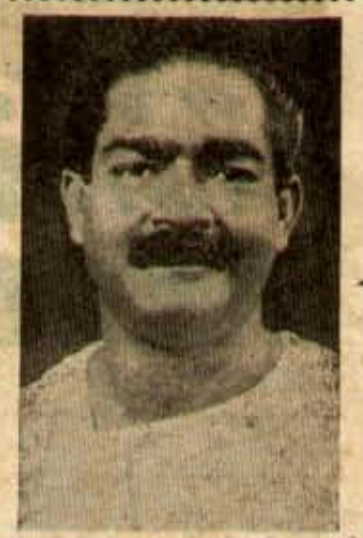
శేరళ మోముంత్రి శ్రీ దాకో

చేతలో ఎటుజోదినా అతివాద వాదావరణం, అతివాద నివాదాలు, అతివాదం వట్టమోజు అవదులు దాటుతున్న ఈ రోజు