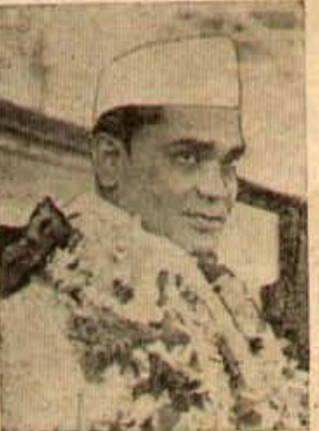
స్థాపన కావచ్చును. కనీసం, అల్లి సమాజ స్థాపనకు మార్గం సుగమం కావచ్చును. కాంగ్రెస్ సంస్థలో లీనమైన సోషలిస్టులందరినీ ఒక క్రా ది మీ ద నడవడానికి జయ ప్రకాశ్ కంటే సమర్థుడెవడు?

మనం సమీక్షించేవారం జయప్రకాశ్ సప్రాహం అంటే అతివేయికి కావనుకుంటాము. ఈ దేశంలో వెప్రకా తర్వాత ప్రపంచ రాజకీయాలు తెలిగినవాడు, వర్తనంగ వరికాగి, సర్వోదయంలో ముగిసినవేదాడు, ఏవిధంగామూడినా లో క మా న్యు డు, వేళంలో అందరి అభిమానాన్ని మార గొన్నవాడు ఎవడయ్యా అంటే జయప్రకాశ్ కు జయప్రకాశ్ వారాయణ అనే సమాధానం రాకవచ్చును. అయిన, ఇటీవల, సరళ గ్రామధాన-బాడి నూత్నవిధాన-కాంకేసినా నిర్మాణ కార్యక్రమంలో విహారలో ఒక మండల క్రయంలో కేంద్రీకరించి త న్య యు చై క్కవీ తేయవలెనని వూసుకున్నాడు. అయి దేండ్లవరకు కడలనన్నాడు. కాని దేశం మళ్ళీ అయినను కడిలిం దింది. కడిలింకక తప్పదు. రత్నగర్వమైన భారతావనిగన్న రత్నములలో మహా ప్రకాశవంతమైనదిగదా జయప్రకాశ్ వారాయణ పేరుగల రత్నం! దానిని, సంకలన సమయంలో, విడిది, ఎవ్వరూరకుండ గలదు? అయినను భారతమాత అబ్బొంది కార్యక్రమ క్ర యా న్ని అబ్బొగింది. 'సోషలిస్టులను ఏకసోషలిస్ట్ సంస్థలో కల్పము. పాక్-భారత మైత్రీని వెల కొట్టము. కాంగ్రెస్ సంస్థలో స్వయంగా ప్రవేశించుము.' ఇందులో ఒక్కొక్క కార్యక్రమాన్ని విడిగా వరిశీలింకాం. జయప్రకాశ్ సర్వోదయసమావేశ్యకానికి సోషలిస్ట్ సమాజ స్థాపనకూ చైరుత్వంలేదు. కాగా సోషలిస్టులంతా ఏకమై, సర్వోదయాన్నుఖలై కృషిచేస్తే, సర్వోదయే సర్వోదయసమాజ