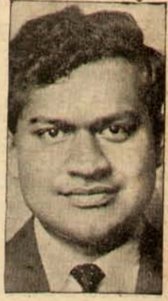
కీ. శే. బ. జా. ప్టా నిర్దాంతాల్లోని లోపాలను సరిచేస్తూ 'ప్రిటివ్ కాన్ఫరెన్స్' ప్రెస్ బోయల్తో కల్పి సూతన గురు క్యాకర్లతో నిర్దాంతాన్ని ప్రతిపాదించి ప్రపంచభాషలను కదిలించిన భారతీయ గణిత కాన్ఫరెన్స్ సాతీకల్ యువకుడు డా. జయంతి విష్ణు నర్సేకర్

అభాగవ్రవంపడు. కాని భరలో? లైతుకన్నివివాదా సమస్యాలను సమకూర్చి, ఎదుపులిద్ది, అప్పులిద్ది, లాభసాటి వ్యవసాయంవేర్చి, కేంద్రమంత్రి ముఖ్యమంత్రి అలీ ప్టా సు సారం అన్నిచేస్తే, (మంత్రివర్గం వ్యాపారాంశం, 'ఇండియన్ ఎక్స్ప్రెస్' 15-8-64) దాన్యం త్వరపడి వ్యవసాయకుడు విక్రయించడు. పంట యెక్కువగావండిలే, భర త క్కు పై నా, యెక్కువపంటవల్ల మందిఅదాయం వచ్చేట్లుంటే అతడు దాన్యాన్ని మార్కెటుకు పంపుతాడు. అంతవంట పండకపోతే, మందిభర పద్దినదాకా అగుతాడు. ప్రభుత్వము సేకరించవలసివే, గిల్లిం త భ ర యివ్వవలెను. అ భరను వినియోగదారులు భరించలేకపోతే ప్రభుత్వం సబ్సిడీవ్వకవచ్చు. భర ఎక్కువైనదని పీటాలుపెందితే, ఇంకా