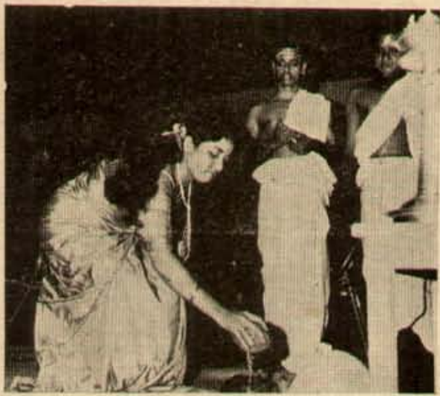
అనుమానా పిలిచువారి 'పల్నాటి పిరకళ్ళ' ద్రిశ ప్రారంభోత్సవంలో పూజచేసి సెంకాయ కొడుకున్న తార జమున