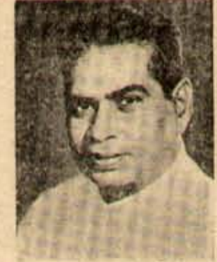
సభ్యులు అంతరించిపోయినట్లు తెలిసి వట్లు విశ్వసనీయంగా తెలియవచ్చింది.