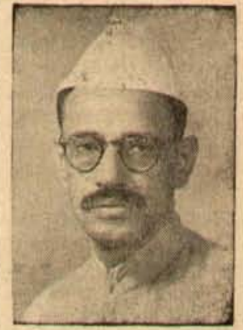
క్రొత్త చుం మంత్రి శ్రీ వంధా

అనాడు ఆ బావనగల్ సూచనను గమనించిపంజే ఈవేళ ఇంత కంకారు పడి కామరాజులు కరణాగతిమై వీడో విధాన సంస్థ రక్షణకై పథకాన్ని ఆకస్మికంగా వ్యతిరేకవలసిన అవసరం వుండేది కాదేమో? వెనుక దింపించుకు వెర్రితనం