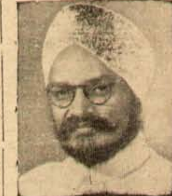
క్రొత్త ఆహారమంత్రి శ్రీ న్యూస్ వేం.

గనక గళ జల సేతులంభనం మూని ముచ్చుంబు చా ర్త వ్యాన్ని గూర్చి యోచించాలం. మొదటిసంగతి: ఎర్రబిచ్చారు మొరార్జీ, -కొరవ ర వ కేటిలా-