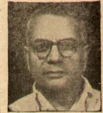
క్రొత్త ఆర్థిక మంత్రి శ్రీ. టి. కృష్ణమాచారి