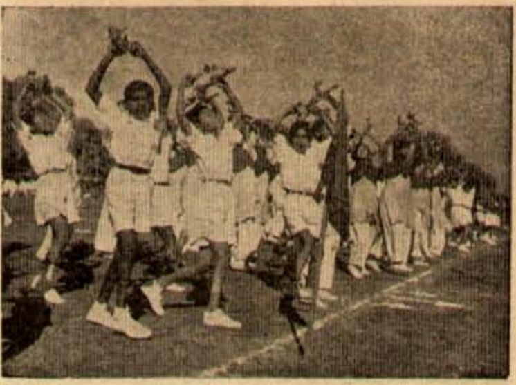
దేశ నక్షత్రము విద్యార్థుల కక్షలు

కలిగింది. అంతేగాక తెన్నెడిగావించిన గంటి కోర్కె (దీనినిసూర్య లోగడ వ్యాఖ్యానించి వుంటుంది) ప్రకారం కలిసి కృషి చేసే రంగాలు అదికం కావలసివున్నవి. అట్టి రంగాలలో ఒకటి పాశ్చాత్యులవారు యిదివరకే పాశ్చాత్యుల ద్వారా ప్రపంచ సంస్కారంలో అత్యధికభాగం పుతయు యు అవహ్యమైన దుర్మార్గాన్ని అంతమొందించడానికేగడా అరిగింది? ప్రపంచంలో పుతయులు వచ్చుకోకాలవేననారు. ఒకరు పాశ్చాత్యులను సూర్యులు నిరసించక, లోలోన అభిమానించినారు. ఈ తలవదా యింపుకో విసుగెత్తి రెండవవారువల్లీ ఆ పాశ్చాత్యుల రాక్షసినినే కొగిలించుకున్నారు. కాని, ఆ కొగిలించలో తమకు నష్టంవస్తుందని ప్రమేపి రాక్షసిగ్రహించి, ఒక్కనాడు ఆకస్మికంగా మామిడుగురైమాకి సర్వ నాశనంజేసింది. అంతకుపూర్వమే రాక్షసి యొక్క దుష్టత్వాన్ని రుచిచూచినవారూ, వీరూ ఏకమైపోరాడి, కేవలం ప్రైవేటు వల్లనే జయించినారా అన్నట్లు, ప్రాణాంతో జయింపబడినారు. వెన్నెంటనే మళ్ళీ అంతా మరలి మిత్రులు శత్రువులై నడించారు. ఇప్పుడికే నమ్మి యిద్దరికీకలిగింది. అందు వలన అతికఠోరమైన దక్షిణాఫ్రికా పాలక వర్గపు వర్ణవిభేదభూరికమైనవర్తనలు అందించడానికి అంతా ఏకమైనారు. ఇదంతా బక్కరాజ్యసమితిద్వారా జరుగు తున్నది. కార్మిదర్మి భాంట్ అనందవర వత్తై వుండవలెను. ఇది అప్రికానియా సీమలు బరానలో సాదించిన మనవిజయం. ద. అప్రికాలో అనేకమందిరై అవశ్యా రోపణలుజేసి పాలకవర్గం హింసించబాను