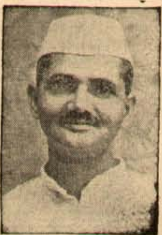
శ్రీ లాల్ బహదూర్

కుంటా మంత్రి పదవిలు మరో నక్కా ర్థమునకు తయారవుతున్నారు. అట్లారి సతీమణి కె.ఎస్.ఎల్. కొన్ని తీర్మాన్లు యివ్వడం దాదాపు జాయమైపోయింది. లాంఛనంగా యీ నిర్ణయం న్ని యీ సాయంత్రం (మంగళవారం) పై వారి అనుమతకోసం పంపుతారు. ఈ విధంగా రాజీ బా డు ల కు అను రులంగా మంత్రి పదవిలులవడే వారు నువ్వద్దావంను ప్రకటిస్తున్నట్లు యింప బడుతున్నది. శ్రీ లాల్ బహదూర్ 28 తేదీ ఇక్కడకు వస్తున్నారు. ఆ మర్నాడు (24) కూడా వారు యిక్కడ వుంటారు. వారు యిక్కడవస్తు సమయంలో ఆంధ్ర కాంగ్రెస్ వ్యవహారాలను సర్దుబాటు