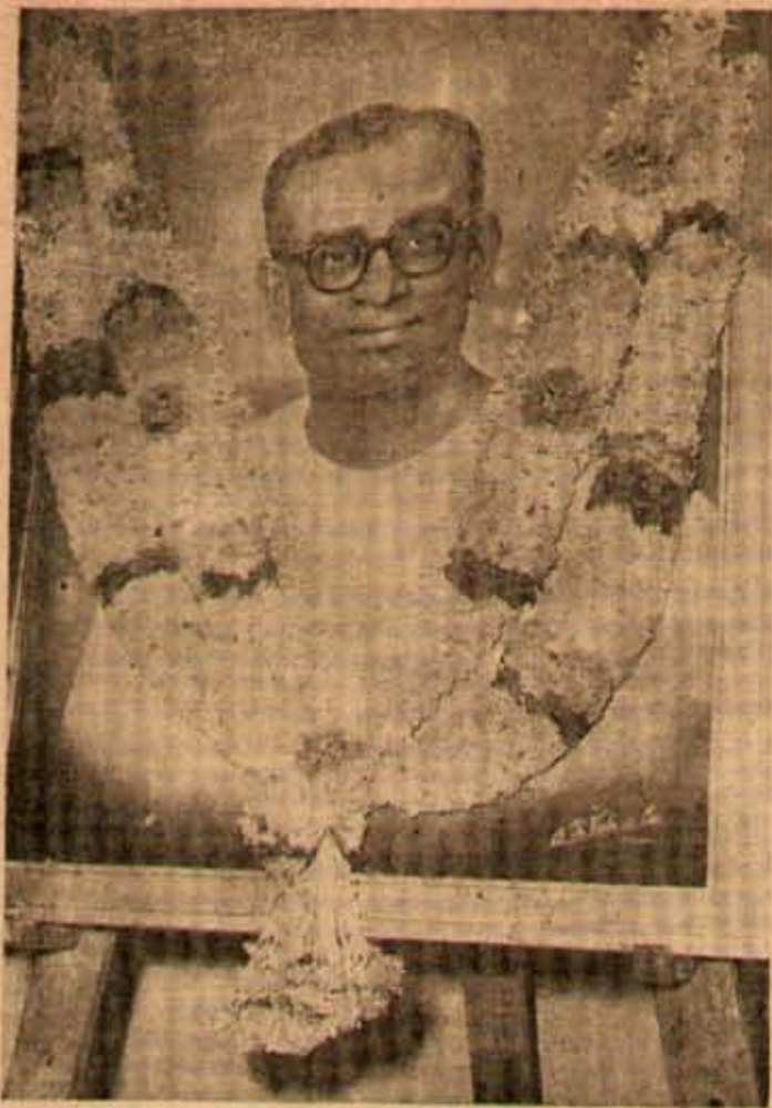
19 తేదీ తల్లపరిశిష్ట కార్యాలయంలో ఆవిష్కరించబడిన ముఖ్యమంత్రి శ్రీ నీలం సంజీవరెడ్డి గారికి రూప దిత్తవస్తు.