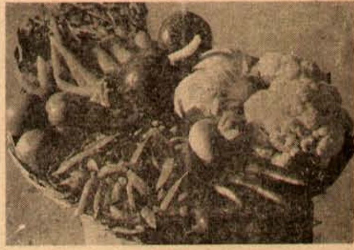
కోరవ రకాల కూరలు!

వచ్చేది చేప వికాలం. చేసవి కాలంలో కొన్ని ప్రాంతాలలో మం దివీళ్ళే వారకవు త్రా గ బా ని కి, యిక కూరగాయల సంగతి చేరే చెప్పాలా? ప్రకృతితత్వం అను మూలంగానే యిలాంటి కొన్ని దోష్ట వచ్చి, అన్ని వనరులూ కలిగిన ప్రాంతాలలో చేసవికాలంలో కూర గాయలు పండించి మీరు తినండి, మరి సబ్బనురీకీ సరవలా చేయండి. అసలు మీరుకష్టపడి, మీచేతులతో