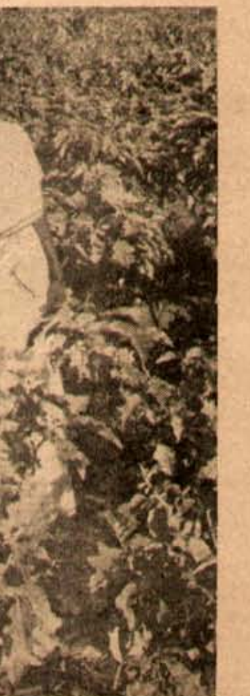
కొరవ పెరటి పంకదొలలో వైపాటుచేస్తున్న వనిశ

రెండవ ప్రపంచయుద్ధకాలంలో శ్రీశివు ప్రజలకు కూరగాయల కరచెట్టుపంపింది. ఒకదోటనుండి మరొకదోటకు కూరగాయ లను రవాణాచేయుట కు వ యో గిం చే లారీలు, ట్రక్కులు చివరకు ఏమానాలు, రై ట్ల కూ డా యుద్ధకార్యకలాపాలకు మాత్రమే వినియోగించబడుట మూలంగా ప్రజలకు కూరగాయలంపక దాల యిబ్బంది వద్దాదు - అలాగని ఆ ప్రభలు కాకూ, చేపలూ ముడుచుకొని మార్కెట్లో పొర్చు లను, అటూరాలను, గు క్కు పు పంజీలు, గోల్సు అంటూడే ప్ర చే కా లు, ప్రభుత్వ కార్యాలయాల ప్రాంతాలు - ఒకటిమిటి ఎక్కడ చాలు గు చతురప్పణాల స్థల ముంకే, ఆ కృ డ క్రమిస్త, దున్ను కూర