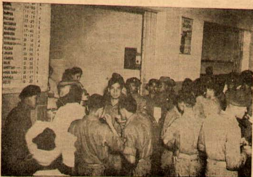
యుద్ధరంగానికి పోతున్న చైనీసులకు లక్ష్యాన్ని తెలియజేయడానికి మహిళాసేనాదళములవారు ఉపయోగించిన కార్యక్రమాలలో ఒకటిగా వర్ణించబడినట్లున్నాయి.

ఈ షాంబే కింకప్రాముఖ్యం రావడానికి కారణం, ఇతడి ఏకీకరణ కారణంగా రాష్ట్రముంబెను. కాంగోలోకూడా ఇది పెద్ద భాగం. అది పిలియున్న దాంట్ల (ఎన్సెక్టెట్రావాలాలో పిలియున్నది) విలువగల లో పా నం వ వ ఈ భాగంలో వున్నది. తెలుసుకోవలసినది ఏమిటంటే ఈ భాగంలో పోరాడి, దివరకు షాంబే దానికి లొంగినాడు.