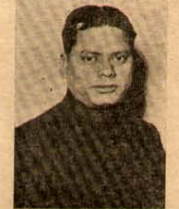
కాంగ్రెస్ అధ్యక్షుడు శ్రీ దామోదరం సంజీవయ్య కృష్ణ జిల్లా కు సమరసంగా పర్యటించారా?

రిబాదా. అభివా కాంగ్రెస్ వల్ల ప్రవేశ సంఘం వర్తనవంబడనే రం కో చం యెవైవా వుంటే ఒక నిర్ణీత గడువులో యీలాంటి విషయాలపై దర్వాస్తావరిసి, నివేదిక వంబ మని కోరవచ్చు. నియమావళిక ప్రకారం జరు గవలసిన యీలాంటి కలాపాలలో యేమీ నిమిత్తం లేకుండానే "కృష్ణాజిల్లా సంఘం సరిగా పనిచేయడంలేదుకాబట్టి అసంపూర్ణు ర్హు చేయడానికి నిశ్చయించాము" అంటూ ఆ జిల్లాలో కాంగ్రెస్ కార్యక్రమాన్ని కొన సాగించేందుకుగాను అడ్డవూకో కమిటిని నియమించడంబాదు కాబట్టి కొన్ని పేర్లు