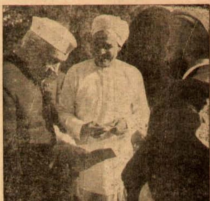
నక్షత్ర నిధికి తపగ్రామం తరపున పెళ్లకులైన్ని బ్యాంకిలో ఇసుకట్టి, ఆ రసీదును ప్రధానికి చూపుతున్న ఒక గ్రామస్థుడు.

వోరుగల నాయకులు ఎక్కడికక్కడ నందులు విగించుకుని, ఖాళీస్థలాల ఆక్రమణలు, విక్రయావ విక్రయాలుగూడ పూర్తి చేసుకోవచ్చు. వాటియగుడిసెల సంఘాలు రెండు ఏర్పడి, ఖాళీస్థలాలలో, ఎక్కడి కక్కడ, చాత్రీ చాత్రీల జండాలు పోతే నున్నాడు. అరెలను కర్తవ్యమేకోవడంతో ప్రారంభించి, ఖాళీగావడివున్న గోశీటోట్లలో పాకలు, తక్కువ ఖాళీ నిర్మాణంధానా సడదిపోతున్నది. ఈ ఖాళీస్థలాల వేటదారులవల్ల వడిపోయి, వల్లపాలనలో మాణిగల అంతర్వేదికావారు తప్పనిసంబులనుకూడా (సంపత్తి దానము తప్ప వేదే — కొరవ 12-వ శీతా