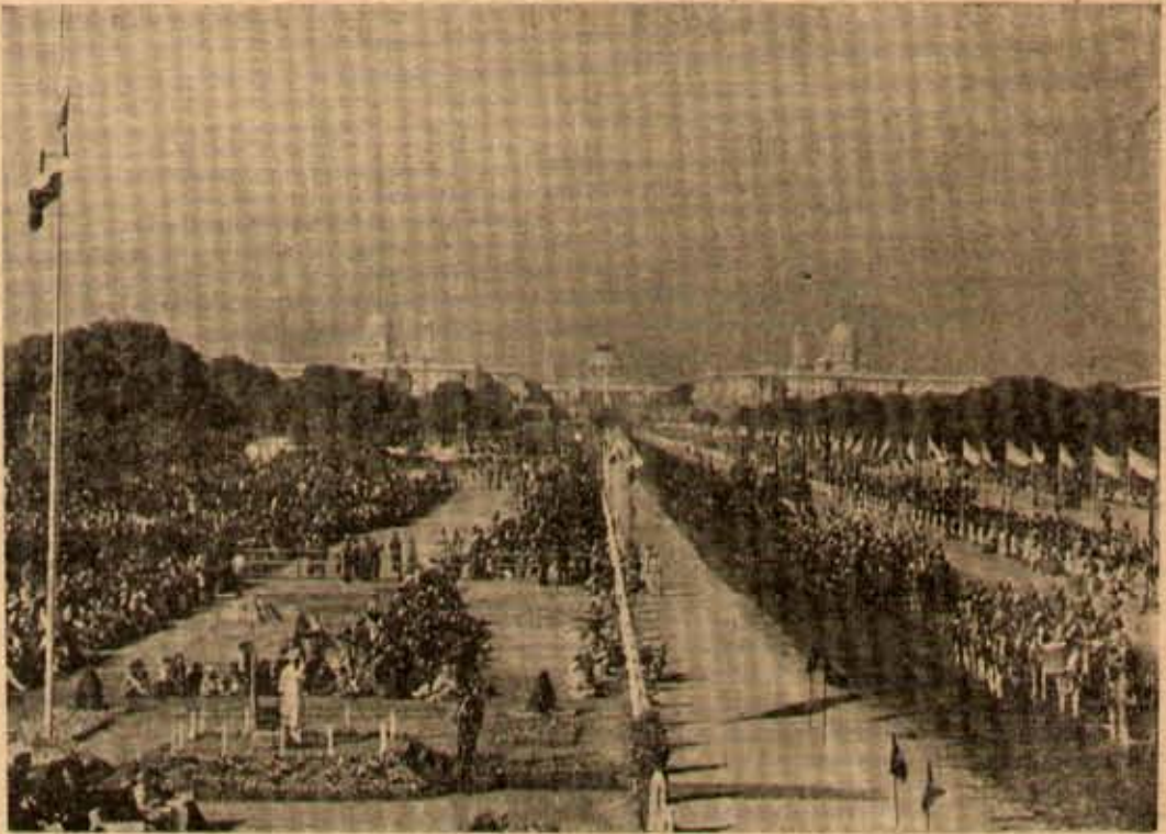
భారతరాజధాని ఢిల్లీలో జనవరి 26 తేదీ రిపబ్లికన్ దిన మహోత్సవాలను పదిలమవుతుంది ప్రజలు తిలకించారు. ఆ పుత్సవాలలో శైలవన్యంగావున్న ఒక భాగమే వైచిత్రం.