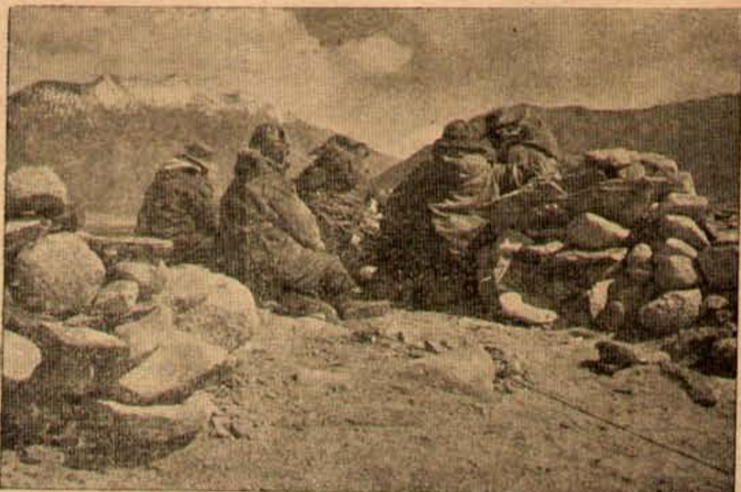
మంచుగొండలమధ్య దేశమార్లు బాగరూరితో కాపలాకాస్తున్న లవ్ కలాని భారత సైనికబృందం.

మాట్టకు హేతువును సరిగా గ్రహించ గలిగినంత వ మ యాన్ని యిచ్చివుంటే ప్రతిపక్ష ప్రవచనం, ప్రతిపక్ష ప్రవచనం వల వరకు ప్రభుత్వ నిర్ణయాన్ని బలపరచి వుండేది. ఇప్పుటి లోకనభ దృశ్యం యొక్క పరిణామం ఏమిటి? ఈ అత్యవసర సమయంలో సైతం ఒక్క నిర్ణయాన్ని చేశారంటూ అంగీ కరించలేకున్నది. ఇం దు కు ముఖ్యమైన కారణం ప్రధానమంత్రి నేతృత్వంలో గల దోషం కాదు. అయిన అభిప్రాయాలకు తగి నంత అర్థనైజేషన్ చేశారేమీ. అందు