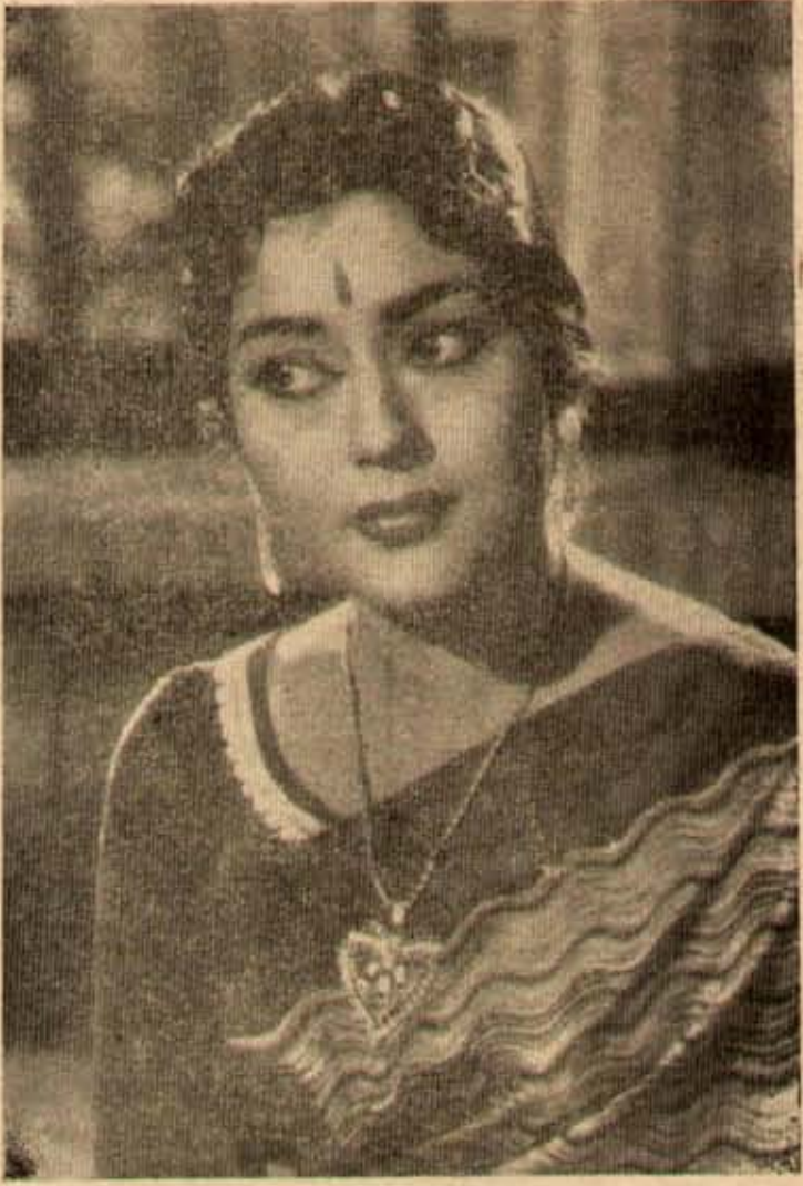
కలవారి కోడలు లో కృష్ణకుమారి సుజీవితంలో కోడలుకాని ఈ కార దిత్రవీధిలో కోడలుకాక తప్పలేదు!

నడదిపోతుంది. అట్లుకాక ఇంకా గ్రూపులు దారితియగలదు. ఈ విషయంలో మంత్రి కట్టుకుంటూ పోవాలనే పేరాకోనే ఉండే ఏ. సి. తనకేమి తెలియనట్లు ఉండటం త్లయితే, రాజకీయంగా అనేక అపార కూడా మందిరికాదంటారు ఇచ్చి రాజకీయ విషయ పరిణామాలకు మున్నుండు యిట్లాలు కొందరు.